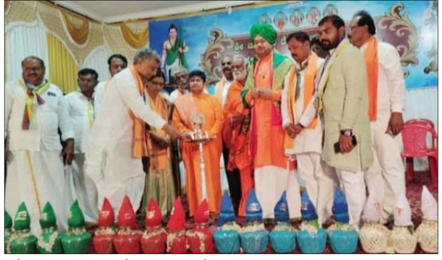
ವಿರೋಧ ರಹಿತ ಶೈವ ಧರ್ಮವೇ ವಿಜೃಂಭಿಸುವುದಕ್ಕಿಂತ ಅವರ ಆದರ್ಶ ಗಳನ್ನು ಅನುಸರಿಸುತ್ತಾ ಅವರ ತತ್ವ ಸಿದ್ಧಾಂತಗಳನ್ನು ನಾವು ನಮ್ಮ ಜೀವನದಲ್ಲಿ ಅಳವಡಿಸಿಕೊಂಡು ನಾವು ಎಂದೂ ಸಾರಿದವರು. ರೇಣುಕಾಚಾರ್ಯರನ್ನು ನಾವು ನಮ್ಮ ಜೀವನದಲ್ಲಿ ಅಳವಡಿಸಿಕೊಂಡು