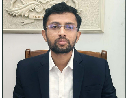
ಖರೀದಿ ಕೇಂದ್ರಗಳಲ್ಲಿ ನೋಂದಾಯಿಸಲಾದ ಅನುಕ್ರಮವಾರು ಮೊದಲು ಮುಂಗಾರು ಋತುವಿನಲ್ಲಿ ಬೆಳೆದ