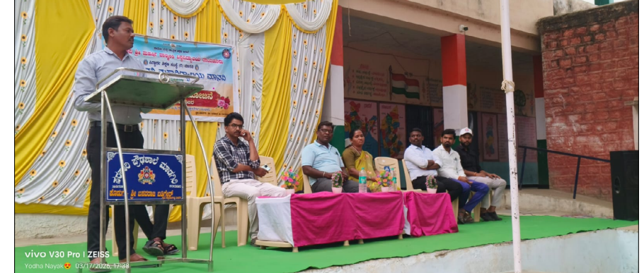
ನಿರ್ಮಿಸುವ ಪ್ರಕ್ರಿಯೆಯನ್ನು ರಾಷ್ಟ್ರ ನಿರ್ಮಾಣ ಎನ್ನುವರು. ಸ್ವಾಮಿ ವಿವೇಕಾನಂದರು ಕಟ್ಟಿರುವ ಮಾಂಸ ಖಂಡಗಳುಳ್ಳ, ಉಕ್ಕಿನ ನರ ಮಂಡಳಿಗಳುಳ್ಳ ಯಾರು ನನ್ನ ದೇಶ ದೇಶ ಎನ್ನುವ ಪರಿಕಲ್ಪನೆಯುಳ್ಳ ಯುವಕರು ಬೇಕು ಎಂದು ಹೇಳಿದಾರೆ. ದೇಶ ನನಗೆ ಏನು ಕೊಟ್ಟಿದೆ ಎನ್ನುವುದಕ್ಕಿಂತ ದೇಶಕ್ಕಾಗಿ ನಾನು ಏನು ಮಾಡಿದೆ ಎನ್ನುವುದು ಬಹಳ ಮುಖ್ಯವಾಗಿರುತ್ತದೆ. ಸ್ವಾಮಿ ವಿವೇಕಾನಂದರ