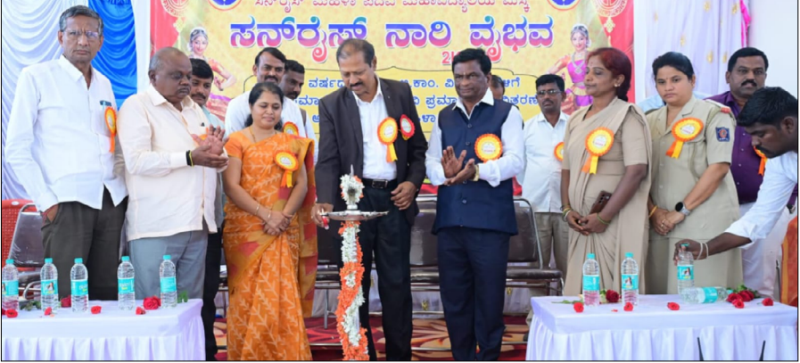
ಮಹಿಳಾ ಪಟ್ಟಣದಲ್ಲಿರುವ ಸನ್ ರೈಸ್ ಮಹಾವಿದ್ಯಾಲಯದಲ್ಲಿ