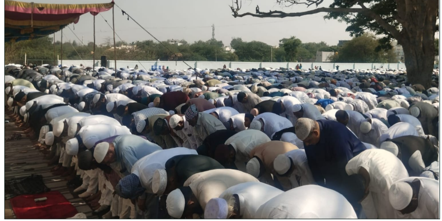
ಭಾಂಡವರು ನಮಾಜ್ ನಲ್ಲಿ ಪಾಲ್ಗೊಂಡರು. ಈಡ್ ಪ್ರಾರ್ಥನೆಯನ್ನು ಮಾಡುವ ಮೂಲಕ ಈಡ್ ಉಲ್ ಫಿತರ್ (ರಂಜಾನ್) ಮುಸ್ಲಿಂಗಳಲ್ಲಿ ಪ್ರಾರಂಭವಾಗುತ್ತದೆ. ಈ ಹಿನ್ನೆಲೆಯಲ್ಲಿ ನಗರದ

ಲಿಂಗಸಗೂರು: ಒಂದು ತಿಂಗಳ ಕಾಲ ಪವಿತ್ರ ರಂಜಾನ್ ಮಾಸದ ಉಪವಾಸ ಆಚರಣೆಯ ಬಳಿಕ ಶುಕ್ರವಾರ ರಾತ್ರಿ ಚಂದ್ರ ದರ್ಶನವಾದ ಹಿನ್ನೆಲೆಯಲ್ಲಿ ಇಂದು ಲಿಂಗಸಗೂರು ತಾಲೂಕಿನಾದ್ಯಂತ ಈಡ್ ಉಲ್ ಫಿತರ್ (ರಂಜಾನ್) ಹಬ್ಬವನ್ನು ಮುಸ್ಲಿಂ ಭಾಂಡವರು ಸಂಭ್ರಮದಿಂದ ಆಚರಿಸಿದರು. ಈಡ್ ಉಲ್ ಫಿತರ್ (ರಂಜಾನ್) ಹಬ್ಬದ ಹಿನ್ನೆಲೆಯಲ್ಲಿ ಇಂದು ಲಿಂಗಸಗೂರಿನ ಕರಡಕಲ್ ಕೆರೆಯ ಹತ್ತಿರ ಈಡ್ ಮೈದಾನದಲ್ಲಿ ಮುಸ್ಲಿಂ ಭಾಂಡವರು ಸಾಮೂಹಿಕ ನಮಾಜ್ ನೆರವೇರಿಸಿ ಈ ನಮಾಜ್ ನಲ್ಲಿ ನೂರಾರು ಮುಸ್ಲಿಂ