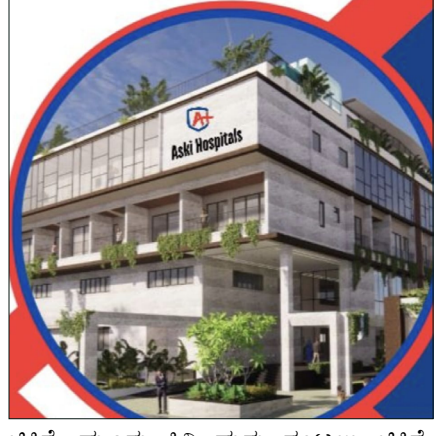
ಚಿಕಿತ್ಸೆ, ಮೂಗು ಕಿವಿ ಮತ್ತು ಗಂಟಲು ಚಿಕಿತ್ಸೆ, ಮೂತ್ರಪಿಂಡಕ್ಕೆ ಸಂಬಂಧಿಸಿದ ರೋಗಗಳಿಗೆ ಹಾಗೂ ಇನ್ನಿತರ ರೋಗಗಳ ತಪಾಸಣೆ ನಡೆಸಿ

ತಾಳಿಕೋಟೆ: ತಾಲೂಕಿನ ಕೋಣೂರು ಗ್ರಾಮದಲ್ಲಿ ಅಸ್ತಿ ಸೂಪರ್ ಸ್ಪೆಷಾಲಿಟಿ ಆಸ್ಪತ್ರೆ ಬಾಗಲಕೋಟೆ ಹಾಗೂ ಬಿ.ಎಸ್.ಪಾಟೀಲ ಫೌಂಡೇಶನ್ (ಸಾಸನೂರು) ಇವರ ಸಹಯೋಗದಲ್ಲಿ ಹಮ್ಮಿಕೊಂಡ ಉಚಿತ ಆರೋಗ್ಯ ತಪಾಸಣಾ ಮಹಾ ಶಿಬಿರ ಇಂದು(ಮಾ.22) ಬೆಳಿಗ್ಗೆ 9:00 ರಿಂದ ಮಧ್ಯಾಹ್ನ 3ರವರೆಗೆ ನಡೆಯಲಿದೆ. ಸದರಿ ಶಿಬಿರದಲ್ಲಿ ಜನರಲ್ ಮೆಡಿಸಿನ್, ಸಕ್ಕರೆ ಕಾಯಿಲೆ, ಬಿಪಿ ಥೈರಾಯ್ಡ್, ಹೃದಯ ದೌರ್ಬಲ್ಯ ಚಿಕಿತ್ಸೆ, ಹೃದಯನಾಳು ಬ್ಲಾಕ್ ಸಲಹೆ, ಸ್ತ್ರೀ ರೋಗ ಹಾಗೂ ಪ್ರಸೂತಿ ಹೆರಿಗೆ ಬಂಜೆತನ, ಗರ್ಭಾಶಯ ತೆರವು ಶಸ್ತ್ರಚಿಕಿತ್ಸೆ, ಎಲಬು ಮತ್ತು ಕೀಲು, ಚಿಕ್ಕ ಮಕ್ಕಳ