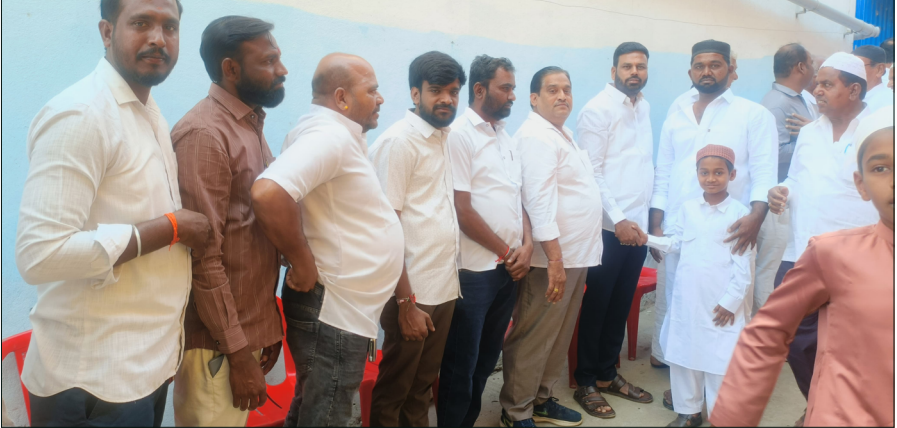
ಮಾನ್ಯ ಪಟ್ಟಣದ ಈದ್ಗಾ ಮೈದಾನದ ಹತ್ತಿರ ರಂಜಾನ್ ಹಬ್ಬದ ಅಂಗವಾಗಿ ಮುಸ್ಲಿಂ