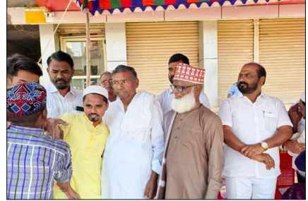
ಧರ್ಮಗಳ ಮಹತ್ವವನ್ನು ಸಾರುವ ಮಹತ್ವರ ಹಬ್ಬವಾಗಿದ್ದು, ಸಮಾಜದಲ್ಲಿ ಶಾಂತಿ, ಸೌಹಾರ್ದತೆ ಹಾಗೂ ಒಗ್ಗಟ್ಟನ್ನು ಬಲಪಡಿಸುವಲ್ಲಿ ಪ್ರಮುಖ ಪಾತ್ರ ವಹಿಸುತ್ತದೆ ಎಂದು ಹೇಳಿದರು. ಎಲ್ಲ ಸಮುದಾಯದ ಜನರು ಒಂದಾಗಿ ಹಬ್ಬವನ್ನು ಆಚರಿಸುತ್ತಿರುವುದು