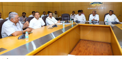
ನಡೆದ ಸಣ್ಣ ನೀರಾವರಿ ವಿಜ್ಞಾನ ಮತ್ತು ತಂತ್ರಜ್ಞಾನ ಸಚಿವರು ಪರಿಷತ್ತಿನ ಸಭಾ ನಾಯಕರಾದ ಶ್ರೀ ಎನ್ ಎಸ್ ಬೋಸರಾಜು ಜೀ ಅವರು, ಸಭೆಯ ಮಾನ್ಯ ಅತಿಥಿಗಳಾದ ಕೆ.ಸಿ ವ್ಯಾಲಿ, ಹೆಚ್.ಎನ್ ವ್ಯಾಲಿ ಮತ್ತು ವ್ಯವಹಾರಿ ವ್ಯಾಲಿಗಳ ಸಂಸ್ಕರಿಸಿದ ನೀರು ಅತ್ಯುತ್ತಮ ಗುಣಮಟ್ಟದ್ದಾಗಿದೆ ಎಂಬುದು ಭಾರತೀಯ ವಿಜ್ಞಾನ ಸಂಸ್ಥೆಯ ವಿಜ್ಞಾನಿಗಳ ಸುದೀರ್ಘ ಸಂಶೋಧನೆಗಳಿಂದ ದೃಢಪಟ್ಟಿದೆ. ಹೀಗಾಗಿ, ಈ ಬಗ್ಗೆ ಸಾರ್ವಜನಿಕರು ಯಾವುದೇ ರೀತಿಯ ಅತಂಕ ಪಡುವ ಅಗತ್ಯವಿಲ್ಲ. ಈ ಯೋಜನೆಗಳಿಂದ ಕೋಲಾರ, ಬೆಂಗಳೂರು ಗ್ರಾಮಾಂತರ, ಚಿಕ್ಕಬಳ್ಳಾಪುರ, ತುಮಕೂರು ಜಿಲ್ಲೆಗಳಲ್ಲಿ ಅಂತರ್ಜಲ ಮಟ್ಟ ಗಣನೀಯವಾಗಿ ವೃದ್ಧಿಸಿದೆ. ಒಂದೆ 1,500 ರಿಂದ 1,800 ಅಡಿಗಳವರೆಗೂ ಕುಸಿದಿದ್ದ ಅಂತರ್ಜಲ, ಈ ಯೋಜನೆಗಳ ಪರಿಣಾಮದಿಂದ

ನೈಜ್ಯ ದೆಸೆ ನ್ಯೂಸ್: ಬೆಂಗಳೂರು: ಸಂಸ್ಕರಿಸಿದ ನೀರಿನಿಂದ ಬೆಂಗಳೂರು ಸುತ್ತಮುತ್ತಲಿನ ಬರ ಓಡಿತ ಜಿಲ್ಲೆಗಳ ಅಂತರ್ಜಲ ಅಭಿವೃದ್ಧಿಪಡಿಸುವ ಉದ್ದೇಶದಿಂದ ಸನ್ಮಾನ್ಯ ಮುಖ್ಯಮಂತ್ರಿಗಳಾದ ಶ್ರೀ ಸಿದ್ದರಾಮಯ್ಯನವರ ನೇತೃತ್ವದಲ್ಲಿ ನಮ್ಮ ಕಾಂಗ್ರೆಸ್ ಸರ್ಕಾರ ಚಾರಿಗೊಳಿಸಿರುವ ಕೆ.ಸಿ ವ್ಯಾಲಿ, ಹೆಚ್.ಎನ್ ವ್ಯಾಲಿ ಮತ್ತು ವ್ಯವಹಾರಿ ವ್ಯಾಲಿಗಳ ನೀರಿನ ಗುಣಮಟ್ಟದ ಕುರಿತು ಇಂದು, ನನ್ನ ಅಧ್ಯಕ್ಷತೆಯಲ್ಲಿ ವಿಧಾನಸೌಧದ ಕಚೇರಿಯಲ್ಲಿ, ಮಾನ್ಯ ಕಂದಾಯ ಸಚಿವರಾದ ಶ್ರೀ ಕೃಷ್ಣ ಬೈರೇಗೌಡ, ಮಾನ್ಯ ಆಹಾರ ಮತ್ತು ನಾಗರಿಕ ಸರಬರಾಜು ಹಾಗೂ ಗ್ರಾಹಕ ವ್ಯವಹಾರಗಳ ಸಚಿವರು, ಬೆಂಗಳೂರು ಗ್ರಾಮಾಂತರ ಜಿಲ್ಲೆಯ ಉಸ್ತುವಾರಿ ಸಚಿವರಾದ ಶ್ರೀ ಕೆ.ಎಚ್. ಮುನಿಯಪ್ಪ, ಮಾನ್ಯ ಉನ್ನತ ಶಿಕ್ಷಣ ಸಚಿವರು ಹಾಗೂ ಚಿಕ್ಕಬಳ್ಳಾಪುರ ಜಿಲ್ಲಾ ಉಸ್ತುವಾರಿ ಸಚಿವರಾದ ಶ್ರೀ ಎಂ.ಸಿ. ಸುಧಾಕರ್ ಅವರ ಸಮಕ್ಷಮದಲ್ಲಿ, ಭಾರತೀಯ ವಿಜ್ಞಾನ ಸಂಸ್ಥೆಯ ವಿಜ್ಞಾನಿಗಳು, ಜಲಮಂಡಳ ಅಧಿಕಾರಿಗಳೊಂದಿಗೆ ಸಂಸ್ಕರಿಸಿದ ನೀರಿನ ಗುಣಮಟ್ಟದ ಕುರಿತು ವಿಸ್ತೃತ ಚರ್ಚೆ