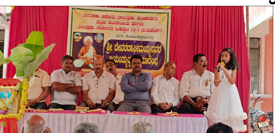
ಅಧಿಕಾರದಿಂದಲೂ ಅನೇಕ ಯಶಸ್ಸುಗಳನ್ನು ತಮ್ಮ ಅಮೋಘ ತಪಸ್ಸಿನಿಂದ ಸಿದ್ಧಿಯನ್ನು ಪಡೆದು ಆಧ್ಯಾತ್ಮಿಕತೆಯ ಮಹತ್ವವನ್ನು ಇಡೀ ವಿಶ್ವಕ್ಕೆ ಸಾರಿದ ಪುಣ್ಯ ಭೂಮಿ ಇದಾಗಿದ್ದು, ಅಂತಹ ಸಾಧನಗಳೆಲ್ಲವನ್ನೂ ಶ್ರೀ ದೇವರ ದಾಸಿಮಯ್ಯನವರೂ ಇವರು