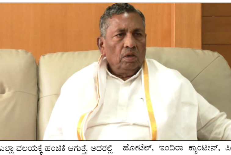
ಎಲ್ಲಾ ವಲಯಕ್ಕೆ ಹಂಚಿಕೆ ಆಗುತ್ತೆ. ಅದರಲ್ಲಿ ಹೋಟೆಲ್, ಇಂದಿರಾ ಕ್ಯಾಂಟೀನ್, ಪಿಜಿ

ರಿಯಾಗಿ ಕಮರ್ಷಿಯಲ್ ಸಿಲಿಂಡರ್ ಪೂರೈಕೆ ಮಾಡಲಾಗುವುದು. ಹೆಚ್ಚುವರಿ 1,000 ಸಿಲಿಂಡರ್ ಸೇರಿಸಿ ಒಟ್ಟು 10,000 ಸಿಲಿಂಡರ್ ಪೂರೈಕೆ ಆಗಲಿದೆ. ಕಮರ್ಷಿಯಲ್ ಗ್ಯಾಸ್ ಬಳಕೆದಾರರು ಕಡ್ಡಾಯವಾಗಿ ರಿಜಿಸ್ಟರ್ ಮಾಡಿಸಬೇಕು. ಗೇಲ್ ಕಂಪನಿಗೆ ರಿಜಿಸ್ಟರ್ ಮಾಡಿಕೊಳ್ಳುವುದು ಕಡ್ಡಾಯ. ಒಂದು ವಾರದೊಳಗೆ ರಿಜಿಸ್ಟರ್ ಮಾಡಬೇಕು. ಅಕ್ರಮ ತಡೆಯಲು ಈ ಕ್ರಮಕೈಗೊಳ್ಳಲಾಗಿದೆ ಎಂದು ಸಚಿವರು ಹೇಳಿದರು. 10 ಸಾವಿರ ಸಿಲಿಂಡರ್‌ನಲ್ಲಿ ಕಮರ್ಷಿಯಲ್ ಗ್ಯಾಸ್ ವ್ಯಾಪ್ತಿಗೆ ಬರುವ