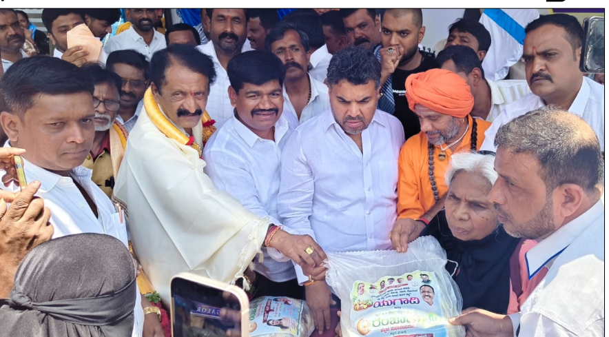
ವಾರ್ಡ್ ನ ನೂರಾರು ಕುಟುಂಬಗಳಿಗೆ ಉಚಿತ ರೇಷನ್ ಪದಾರ್ಥಗಳ ಕಿಟ್ ಗಳನ್ನು ವಾರ್ಡ್ ಗಳಲ್ಲಿ ವಿತರಣೆ ಮಾಡಿದ್ದೇವೆ. ಮುಂದಿನ ದಿನಗಳಲ್ಲಿ ಜನರ ಪರ ಕೆಲಸಗಳಲ್ಲಿ ಅವರ ಕಷ್ಟ ಸುಖಗಳಲ್ಲಿ ಭಾಗವಹಿಸಿ ಪಕ್ಷವನ್ನು ಸಂಘಟಿಸುವ ಕೆಲಸದಲ್ಲಿ ತೊಡಗಿಕೊಂಡಿರುವ ಮುಂದಿನ ಜಿಬಿಎ ಚುನಾವಣೆಯಲ್ಲಿ