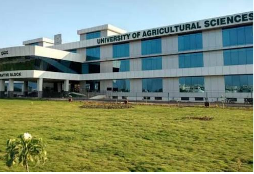
ರಾಯಚೂರು: ಇಲ್ಲಿನ ಕೃಷಿ ವಿಜ್ಞಾನಗಳ ವಿಶ್ವವಿದ್ಯಾಲಯದ 16ನೇ ಅಂತರ್

ಮಹಾವಿದ್ಯಾಲಯಗಳ ಕ್ರೀಡಾಕೂಟಗಳು ಇದೇ ಮಾರ್ಚ್ 26 ರಿಂದ 28 ರವರೆಗೆ ಕೃಷಿ ವಿವಿ ಮತ್ತು ಆವರಣದಲ್ಲಿ ಜರುಗಲಿದೆ. ಈ ಕ್ರೀಡಾ ಕೂಟದಲ್ಲಿ ಪುರುಷ ಮತ್ತು ಮಹಿಳೆಯರ 100ಮೀಟರ್ ಓಟ, 200 ಮೀಟರ್ ಓಟ, 5000 ಮೀಟರ್ ಓಟ, 10,000ಮೀಟರ್ ಓಟ, ಜೊತೆಗೆ ಪೋಲ್ ವಾಲ್ಟ್ ಜಾವೆಲಿನ್ ಎಸೆತ, 4*400 ರಿಲೇ ಓಟಗಳು ನಡೆಯಲಿದ್ದು, ಇದರಲ್ಲಿ ಒಟ್ಟು 70 ವಿದ್ಯಾರ್ಥಿನಿಯರನ್ನೊಳಗೊಂಡಂತೆ ಒಟ್ಟು 125 ವಿದ್ಯಾರ್ಥಿಗಳು ಭಾಗವಹಿಸುವರು. ಈ ಕ್ರೀಡಾ ಕೂಟದಲ್ಲಿ ಕೃಷಿ ಮಹಾವಿದ್ಯಾಲಯ ರಾಯಚೂರು, ಕೃಷಿ ತಾಂತ್ರಿಕ ಮಹಾವಿದ್ಯಾಲಯ ರಾಯಚೂರು, ಕೃಷಿ ಮಹಾವಿದ್ಯಾಲಯ ಕಲಬುರಗಿ, ಕೃಷಿ ಮಹಾವಿದ್ಯಾಲಯ ಗಂಗಾವತಿ ಹಾಗೂ ಕೃಷಿ ಮಹಾವಿದ್ಯಾಲಯ ಹಗರಿ, ಗಳು ಭಾಗವಹಿಸಲಿವೆ. ಕ್ರೀಡಾಕೂಟಕ್ಕೆ ವಿಶ್ವವಿದ್ಯಾಲಯದ ಗೌರವಾನ್ವಿತ ಕುಲಪತಿಗಳಾದ ಡಾ. ಎಂ. ಹನುಮಂತಪ್ಪ ಅವರು ಚಾಲನೆ ನೀಡಲಿದ್ದಾರೆ. ಮುಖ್ಯ ಅತಿಥಿಗಳಾಗಿ ಮಾನ್ಯ ವಿಧಾನ ಪರಿಷತ್ ಸದಸ್ಯರು ಹಾಗೂ ಗೌರವಾನ್ವಿತ ವ್ಯವಸ್ಥಾಪನಾ ಮಂಡಳಿಯ ಸದಸ್ಯರಾದ ಶರಣಗೌಡ ಪಾಟೀಲ್ ಬಯ್ಯಾಪುರ ಅವರು ಭಾಗವಹಿಸಲಿದ್ದಾರೆ. ಗೌರವಾನ್ವಿತ ವ್ಯವಸ್ಥಾಪನಾ ಮಂಡಳಿಯ ಸದಸ್ಯರುಗಳಾದ ಬಸನಗೌಡ ಬ್ಯಾಗವಟ್, ಮಲ್ಲಿಕಾರ್ಜುನ ಡಿ., ಮಲ್ಲೇಶ ಕೊಲಿಮಿ, ಮಧುಸೂದನ್ ರೆಡ್ಡಿ, ತಿಮ್ಮಣ್ಣ ಸೋಮಪ್ಪ ಚಾವಡಿ ಹಾಗೂ ವಿಶ್ವವಿದ್ಯಾಲಯದ ಎಲ್ಲಾ ಅಧಿಕಾರಿಗಳಿಂದ ಕೂಡ ಉಪಸ್ಥಿತರಿಯುವರು ಎಂದು ದೈಹಿಕ ತಿಕ್ಲೇ ವಿಭಾಗದ ಮುಖ್ಯಸ್ಥರಾದ ಡಾ.ರಾಜಣ್ಣ ಅವರು ಪ್ರಕಟಣೆಯಲ್ಲಿ ತಿಳಿಸಿದ್ದಾರೆ.