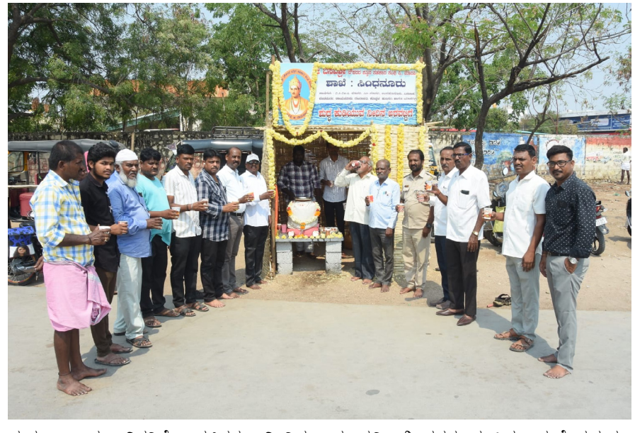
ಮತ್ತು ಸಾರ್ವಜನಿಕರಿಗೆ ಹಳ್ಳಿಗರ ನೀರಿನ ದಾಹ ತಣಿಸಲು ಸಹಕಾರಿಯಾಗಿದೆ ಎಂದರು. ನಮ್ಮ ಸಂಸ್ಥೆಯ ಶಾಖೆಗಳಾದ ಮಾನವಿ ಲಿಂಗಸಗೂರು, ಸಿರವಾರ, ದೇವದುರ್ಗ, ರಾಯಚೂರು, ಗಂಗಾವತಿ, ಕೊಪ್ಪಳ, ಮಣಸಗಿ ಹಾಗೂ ಯಾದಗಿರಿ ನಗರಗಳಲ್ಲಿ ದಿನ