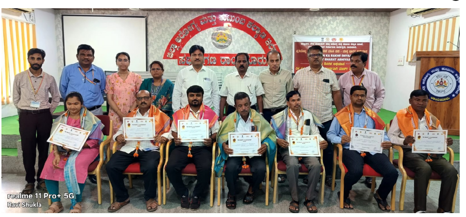
ರಿಗಳು ಇವರ ನಿರಂತರ ಸಮನ್ವಯದಿಂದ ಗ್ರಾಮ ಪಂಚಾಯತಿಯ ಜನಪ್ರತಿನಿಧಿಗಳ ಬೆಂಬಲದಿಂದ ಕಳೆದ 2024 ರಲ್ಲಿ 07 ಗ್ರಾಮ ಪಂಚಾಯತಿಗಳು ಕಂಚಿನ ಪದಕ ಪ್ರಶಸ್ತಿಗೆ ಆಯ್ಕೆಯಾಗಿದ್ದವು. ಪ್ರಸ್ತುತ 2025 ರಲ್ಲಿ 18 ಗ್ರಾಮ ಪಂಚಾಯತಿಗಳು ಪೈಕಿ ಶಾವಂತಗೇರಾ ಗ್ರಾಮ ಪಂಚಾಯತ್ ಬೆಳಿ ಪದಕ ಹಾಗೂ ಇತರ 17 ಗ್ರಾಮ ಪಂಚಾಯತಿಗಳು ಕಂಚಿನ ಪದಕಕ್ಕೆ ಆಯ್ಕೆಯಾಗಿವೆ ಎಂದರು.

ನೈಜ್ಯ ದೆಸೆ ನ್ಯಾಸ್ ರಾಯಚೂರು: ವಿಶ್ವ ಕ್ಷಯರೋಗ ದಿನಾಚರಣೆ ಅಂಗವಾಗಿ ಭಾರತ ಸರ್ಕಾರದ ಮಾರ್ಗಸೂಚಿ-ಯನ್ವಯ ಜಿಲ್ಲೆಯ 18 ಗ್ರಾಮ ಪಂಚಾಯತಿಗಳು ಕ್ಷಯಮುಕ್ತ ಗ್ರಾಮ ಪಂಚಾಯತಿಗೆ ಆಯ್ಕೆಯಾಗಿದ್ದು, ಕಲ್ಯಾಣ ಕರ್ನಾಟಕ ಭಾಗದಲ್ಲಿ ಕ್ಷಯರೋಗ ತಡೆಗೆ ಬೆಂಬಲವಾಗಿದೆ ಎಂದು ಜಿಲ್ಲಾ ಆರೋಗ್ಯ ಮತ್ತು ಕುಟುಂಬ ಕಲ್ಯಾಣಾಧಿಕಾರಿ ಡಾ.ಸುರೇಂದ್ರಬಾಬು ಅವರು ಹೇಳಿದರು. ಮಾರ್ಚ್ 24ರ ಮಂಗಳವಾರ ದಂದು ನಗರದ ಜಿಲ್ಲಾ ಆರೋಗ್ಯ ಮತ್ತು ಕುಟುಂಬ ಕಲ್ಯಾಣ ಇಲಾಖೆಯ ಕೃಷ್ಣ ಸಭಾಂಗಣದಲ್ಲಿ ಜಿಲ್ಲಾಡಳಿತ, ಜಿಲ್ಲಾ ಪಂಚಾಯತ್, ಜಿಲ್ಲಾ ಆರೋಗ್ಯ ಮತ್ತು ಕುಟುಂಬ ಕಲ್ಯಾಣ ಇಲಾಖೆ, ರಾಷ್ಟ್ರೀಯ ಕ್ಷಯರೋಗ ನಿರ್ಮೂಲನೆ ವಿಭಾಗ ಇವರ ಸಂಯುಕ್ತಶ್ರಮದಲ್ಲಿ ಹಮ್ಮಿಕೊಳ್ಳಲಾಗಿದ್ದ ಕ್ಷಯಮುಕ್ತ ಗ್ರಾಮ ಪಂಚಾಯತಿಗಳಿಗೆ ಪ್ರಶಸ್ತಿ ವಿತರಿಸಿ ಅವರು ಮಾತನಾಡಿದರು. ಜಿಲ್ಲೆಯ ಜಿಲ್ಲಾಧಿಕಾರಿಗಳ ಮಾರ್ಗದರ್ಶನ, ಜಿಲ್ಲಾ ಪಂಚಾಯತ ಮುಖ್ಯ ಕಾರ್ಯನಿರ್ವಾಹಕ ಅಧಿಕಾರಿ-