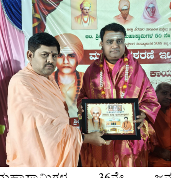
ಮಹಾಸ್ವಾಮಿಗಳ 36ನೇ ಜನ್ಮ ವರ್ಧಂತಿ ಮಹೋತ್ಸವದ ನಿಮಿತ್ತವಾಗಿ ಹಮ್ಮಿಕೊಂಡ ಮಹಾ ಶಿವಶರಣೆ ಇಟಗಿ ಶ್ರೀ ಭೀಮಾಂಬಿಕೆ ಪುರಾಣ