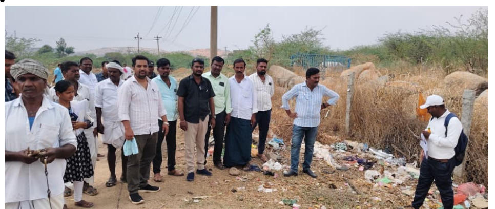
ಸೌಲಭ್ಯವನ್ನು ಬಳಸುತ್ತಿದ್ದರು. ಆದರೆ, ಈ ಜಾಗ ಖಬರಸ್ಥಾನಕ್ಕೆ ಸೇರಿದ ಎಂಬ ವಿವಾದ ಉಂಟಾಗಿ, ಕೆಲ ವರ್ಷಗಳ ಹಿಂದೆ ಶೌಚಾಲಯವನ್ನು ನೆಲಸಮಗೊಳಿಸಲಾಗಿತ್ತು. ಈ ಘಟನೆಯ ನಂತರ ಸಮಸ್ಯೆ ಇನ್ನಷ್ಟು ಗಂಭೀರಗೊಂಡು, ಸಮುದಾಯಗಳ ನಡುವೆ ಅಸಮಾಧಾನ ಹಾಗೂ ಆತಂಕಿಯ ವಾತಾವರಣ ನಿರ್ಮಾಣವಾಗಿತ್ತು. ಈ ವಿವಾದವನ್ನು ರಾಜಕೀಯವಾಗಿ ಬಳಸಿಕೊಂಡು ಸಮುದಾಯಗಳ ನಡುವೆ ಭಿನ್ನಾಭಿಪ್ರಾಯಗಳನ್ನು ಉಂಟುಮಾಡುವ ಪ್ರಯತ್ನಗಳು ನಡೆದಿದ್ದವು ಎಂಬ ಆರೋಪಗಳೂ ಕೇಳಿಬಂದಿದ್ದವು. ಆದರೆ, ಇತ್ತೀಚೆಗೆ ಸಂಘಟ-

ನೈಜ್ಯ ದೆಸೆ ನ್ಯೂಸ್ ಕವಿತಾಳ: ರಾಯಚೂರು ಜಿಲ್ಲೆ ಸಿರವಾರ ತಾಲೂಕಿನ ಕವಿತಾಳ ಪಟ್ಟಣದಲ್ಲಿ ಹಲವು ವರ್ಷಗಳಿಂದ ಮುಂದುವರಿದಿದ್ದ ಖಬರಸ್ಥಾನ ಹಾಗೂ ಸಾಮೂಹಿಕ ಶೌಚಾಲಯಕ್ಕೆ ಸಂಬಂಧಿಸಿದ ಭೂ ವಿವಾದಕ್ಕೆ ಕೊನೆಗೂ ಭಾಗಶಃ ಪರಿಹಾರ ದೊರೆತಿದೆ. ಸರ್ವೆ ಇಲಾಖೆಯ ಸಮಗ್ರ ಮಾಪನ ಕಾರ್ಯ ಯಶಸ್ವಿಯಾಗಿ ಪೂರ್ಣಗೊಂಡ ಹಿನ್ನೆಲೆಯಲ್ಲಿ, ಸ್ಥಳೀಯರಲ್ಲಿ ಉಂಟಾಗಿದ್ದ ಉದ್ವಿಗ್ನತೆ ತಣಿಸಿದ. ಪಟ್ಟಣದ ಸರ್ವೆ ನಂ. 8ಕ್ಕೆ ಸಂಬಂಧಿಸಿದ ಈ ಜಾಗದಲ್ಲಿ ಕಳೆದ ನಾಲ್ಕು ದಶಕಗಳಿಂದ ಸಾರ್ವಜನಿಕ ಉಪಯೋಗಕ್ಕಾಗಿ ನಿರ್ಮಿಸಲ್ಪಟ್ಟಿದ್ದ ದೊಡ್ಡ ಸಾಮೂಹಿಕ ಶೌಚಾಲಯವೊಂದು ಕಾರ್ಯನಿರ್ವಹಿಸುತ್ತಿತ್ತು. ಐದು ವಾರ್ಡ್‌ಗಳಿಗೆ ಸೇರಿದ ಸಾವಿರಾರು ಮಹಿಳೆಯರು ಹಾಗೂ ಸಾರ್ವಜನಿಕರು ಈ