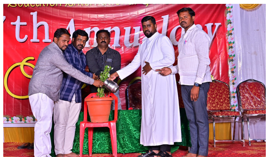
ಅವರ ಆತ್ಮವಿಶ್ವಾಸವನ್ನು ಹೆಚ್ಚಿಸುವಲ್ಲಿ ಮಹತ್ವದ ಪಾತ್ರವಹಿಸುತ್ತವೆ. ಪೋಷಕರು ಮತ್ತು ಶಿಕ್ಷಕರು ಮಕ್ಕಳಿಗೆ ಉತ್ತಮ ಮಾರ್ಗದರ್ಶನ ನೀಡಿದಾಗ ಮಾತ್ರ ಸಮಗ್ರ