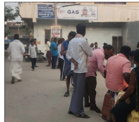
ಅಭಾವ ಸೃಷ್ಟಿಸುತ್ತಿರುವವರು ಯಾರು ? ಇದಕ್ಕೆ ಯಾರು ಹೊಣೆಗಾರರು ? ಕೂಡಲೇ ಅಧಿಕಾರಿಗಳು ಸಮಸ್ಯೆ ಆಗದಂತೆ ನೋಡಿಕೊಳ್ಳಬೇಕು ಎನ್ನುವುದು ಗ್ರಾಹಕರು ಬೇಡಿಕೆಯು ಆಗಿದೆ.