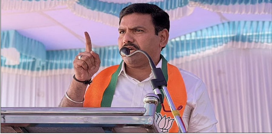
ಶಾಸಕರು ಬೇಡಿಕೆಯಿಟ್ಟಿರುವುದು ರಾಜ್ಯ ರಾಜಕೀಯ ವಲಯದಲ್ಲಿ ಭಾರೀ ಚರ್ಚೆಗೆ ಕಾರಣವಾಗಿದೆ.

ವಿಧಾನಸಭೆಯಲ್ಲಿ ವಿರೋಧ ಪಕ್ಷದ ನಾಯಕ ಆರ್.ಅಶೋಕ ಮತ್ತು ಕಾಂಗ್ರೆಸ್‌ನ ಕೆಲವು ಸದಸ್ಯರು ಶಾಸಕರಿಗೆ ತಲಾ 5 ಟಿಕೆಟ್ ನೀಡಬೇಕು, ಪಂದ್ಯ ವೀಕ್ಷಣೆಗೆ ಪ್ರತ್ಯೇಕ ಗ್ಯಾಲರಿ ವ್ಯವಸ್ಥೆ ಮಾಡಬೇಕು ಎಂದು ಉಪಮುಖ್ಯಮಂತ್ರಿ ಡಿ. ಕೆ.ಶಿವಕುಮಾರ್ ಅವರಿಗೆ ಒತ್ತಾಯಿಸಿದ್ದರು. ಸಭಾಧ್ಯಕ್ಷ ಯು.ಟಿ.ಖಾದರ್ ಕೂಡ ಇದನ್ನು ಬಲವಾಗಿ ಪ್ರತಿಪಾದಿಸಿದ್ದರು. ಈ ಕುರಿತು ಪ್ರತಿಕ್ರಿಯೆ ನೀಡಿರುವ ಬಿಜೆಪಿ ರಾಜ್ಯಾಧ್ಯಕ್ಷ ಬಿ.ವೈ.ವಿಜಯೇಂದ್ರ ಅವರು, ಆಡಳಿತ ಪಕ್ಷ, ವಿಪಕ್ಷಗಳ ಶಾಸಕರ ಹೇಳಿಕೆಯನ್ನು ಗಮನಿಸಿದ್ದೇನೆ. ವೈಯಕ್ತಿಕವಾಗಿ ಅವರ ಹೇಳಿಕೆಗಳನ್ನು ಒಪ್ಪುವುದಿಲ್ಲ. ರಾಜಕಾರಣಿಗಳೆಂದರೆ ಜನಸಾಮಾನ್ಯರು ನಮ್ಮನ್ನು ಯಾವ ರೀತಿ ನೋಡುತ್ತಾರೆ ಎಂಬುದನ್ನು