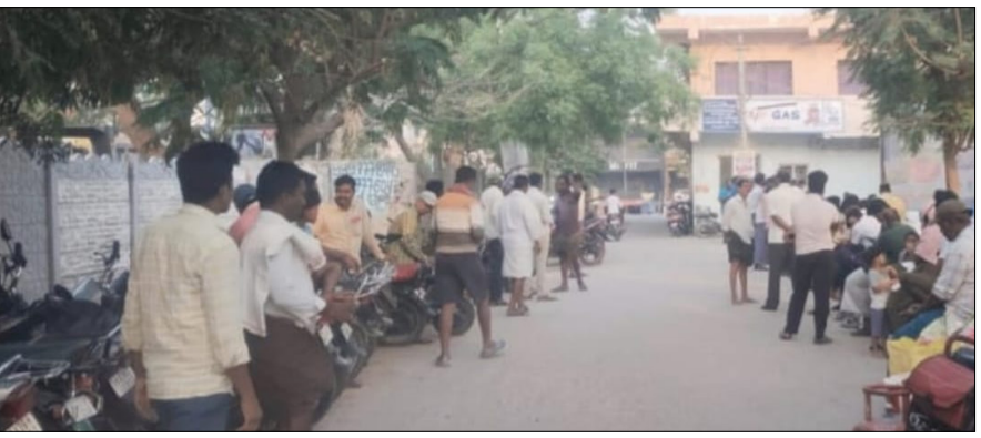
ರಿಗಗಳು ಹೇಳುತ್ತಿದ್ದು, ನಗರದಲ್ಲಿ ಕರ್ಮಿಯಲ್ ಜೊತೆಗೆ ಗೃಹ ಬಳಕೆ ಸಿಲಿಂಡರ್ ಗಳ ಕೊರತೆ ಇದೆ ಎನ್ನುವುದಕ್ಕೆ ಸಿಲಿಂಡರ್ ಗಾಗಿ ಜನರು ಗ್ಯಾಸ್ ಏಜೆನ್ಸಿ ಅಂಗಡಿಗಳ ಮುಂದೆ ಸಾಲುಗಟ್ಟಿ ನಿಂತಿರುವುದೇ ಸಾಕ್ಷಿ. ಕರ್ಮಿಯಲ್ ಸಿಲಿಂಡರ್ ಗಳು ಸಿಗದೆ ಇರುವುದರಿಂದ ನಗರದಲ್ಲಿ ಹಲವಾರು ಹೋಟೆಲ್ ಗಳು ಈಗಾಗಲೇ ಬಂದ ಮಾಡಲಾಗಿವೆ. ಕೆಲವು ಹೋಟೆಲ್ ಮಾಲೀಕರು ದುಬಾರಿ ಹಣ ನೀಡಿ ಸಿಲಿಂಡರ್ ತಂದರೆ, ಇನ್ನೂ ಕೆಲವರು ಗೃಹ ಬಳಕೆಯ ಸಿಲಿಂಡರ್ ಗಳನ್ನು ತಂದು ಹೋಟೆಲ್ ನಡೆಸುವುದು ಕಂಡು ಬಂದಿದೆ. ಇಲಾಖೆ ಸಿಲಿಂಡರ್ ಅಭಾವ ಇಲ್ಲ ಎನ್ನುತ್ತದೆ. ಸಿಲಿಂಡರ್ ಗಾಗಿ ಜನರು ಸಾಲುಗಟ್ಟಿ ಏಜೆನ್ಸಿ ಮುಂದೆ ನಿಂತಿರುವುದು ಎಲ್ಲೆಡೆ ಕಾಣುತ್ತದೆ. ಹಾಗಾದರೆ ಸಿಲಿಂಡರ್

ಕರ್ಮಿಯಲ್ ಸಿಲಿಂಡರ್ ಸಿಗದೆ ಅನೇಕ ಹೋಟೆಲ್ ಗಳು ಬಾಗಿಲು ಹಾಕಿವೆ. ತಿಂಡಿ ತಿನಿಸುಗಾಗಿ ಗ್ರಾಹಕರು ಹೋಟೆಲ್ ಗಳಿಗಾಗಿ ಹುಡುಕಾಟ ನಡೆಸುತ್ತಿದ್ದಾರೆ. ಕರ್ಮಿಯಲ್ ಸಿಲಿಂಡರ್ ಅಭಾವ ಇದೆ, ಅದೇ ಗೃಹ ಬಳಕೆ ಸಿಲಿಂಡರ್ ಗಳ ಅಭಾವ ಇಲ್ಲ ಎಂದು ಆಹಾರ ಇಲಾಖೆಯ ಅಧಿಕಾರಿಗಳು ಹೇಳುತ್ತಿದ್ದಾರೆ. ನಗರದಲ್ಲಿ ಗೃಹ ಬಳಕೆಯ ಸಿಲಿಂಡರ್ ಗಾಗಿ ಜನರು ಸಾಲುಗಟ್ಟಿ ನಿಂತಿರುವ ದೃಶ್ಯವಂತೂ ಏಜೆನ್ಸಿ ಅಂಗಡಿಗಳ ಮುಂದೆ ಕಂಡು ಬರುತ್ತಿದೆ. ನಗರದ ಗ್ಯಾಸ್ ಏಜೆನ್ಸಿ ಮುಂದೆ ಸಿಲಿಂಡರ್ ಗಾಗಿ ನೂರಾರು ಜನರು ಖಾಲಿ ಸಿಲಿಂಡರ್ ಗಳನ್ನು ಹಿಡಿದು ಸಾಲುಗಟ್ಟಿ ನಿಂತಿದ್ದು ಕಂಡು ಬಂತು. ಕರ್ಮಿಯಲ್ ಸಿಲಿಂಡರ್ ಜೊತೆಗೆ ಗೃಹ ಬಳಕೆ ಸಿಲಿಂಡರ್ ಅಭಾವ ಸೃಷ್ಟಿಯಾಗಿದೆ. ಕರ್ಮಿಯಲ್ ಸಿಲಿಂಡರ್ ಗಳ ಕೊರತೆ ಇದೆ. ಆದರೆ ಗೃಹ ಬಳಕೆ ಸಿಲಿಂಡರ್ ಕೊರತೆ ಇಲ್ಲ, ಯಾವುದೇ ಕಾರಣಕ್ಕೂ ಕೃತಕ ಅಭಾವ ಸೃಷ್ಟಿಸುವ ಏಜೆನ್ಸಿ ವಿರುದ್ಧ ಕ್ರಮ ಕೈಗೊಳ್ಳುವುದಾಗಿ ಆಹಾರ ಇಲಾಖೆಯ ಅಧಿಕಾರಿಗಳು ಹೇಳುತ್ತಿದ್ದು, ನಗರದಲ್ಲಿ ಕರ್ಮಿಯಲ್ ಜೊತೆಗೆ ಗೃಹ ಬಳಕೆ ಸಿಲಿಂಡರ್ ಗಳ ಕೊರತೆ ಇದೆ ಎನ್ನುವುದಕ್ಕೆ ಸಿಲಿಂಡರ್ ಗಾಗಿ ಜನರು ಗ್ಯಾಸ್ ಏಜೆನ್ಸಿ ಅಂಗಡಿಗಳ ಮುಂದೆ ಸಾಲುಗಟ್ಟಿ ನಿಂತಿರುವುದೇ ಸಾಕ್ಷಿ. ಕರ್ಮಿಯಲ್ ಸಿಲಿಂಡರ್ ಗಳು ಸಿಗದೆ ಇರುವುದರಿಂದ ನಗರದಲ್ಲಿ ಹಲವಾರು ಹೋಟೆಲ್ ಗಳು ಈಗಾಗಲೇ ಬಂದ ಮಾಡಲಾಗಿವೆ. ಕೆಲವು ಹೋಟೆಲ್ ಮಾಲೀಕರು ದುಬಾರಿ ಹಣ ನೀಡಿ ಸಿಲಿಂಡರ್ ತಂದರೆ, ಇನ್ನೂ ಕೆಲವರು ಗೃಹ ಬಳಕೆಯ ಸಿಲಿಂಡರ್ ಗಳನ್ನು ತಂದು ಹೋಟೆಲ್ ನಡೆಸುವುದು ಕಂಡು ಬಂದಿದೆ. ಇಲಾಖೆ ಸಿಲಿಂಡರ್ ಅಭಾವ ಇಲ್ಲ ಎನ್ನುತ್ತದೆ. ಸಿಲಿಂಡರ್ ಗಾಗಿ ಜನರು ಸಾಲುಗಟ್ಟಿ ಏಜೆನ್ಸಿ ಮುಂದೆ ನಿಂತಿರುವುದು ಎಲ್ಲೆಡೆ ಕಾಣುತ್ತದೆ. ಹಾಗಾದರೆ ಸಿಲಿಂಡರ್