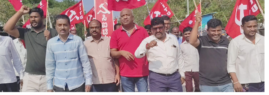
ಲಿಂಗಸಗೂರು: ಹಟ್ಟಿ ಚಿನ್ನದ ಗಣಿಗೆ ಸಿಐಟಿಯು ಮತ್ತು ಕಾರ್ಮಿಕ ಸಂಘದ ವತಿಯಿಂದ ಮೇ 1ರಂದು