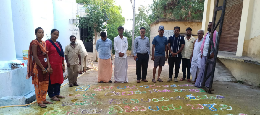
ನೀರಿನ ಹರಿವು ಸುಧಾರಣೆ ಮೊದಲಾದ ಸಾರ್ವಜನಿಕ ಸ್ಥಳಗಳು ಸೇರಿದಂತೆ ಎಲ್ಲೆಡೆ ಶುದ್ಧತೆ ಕಾಪಾಡುವಲ್ಲಿ ತೊಡಗಿಸಿಕೊಂಡಿದ್ದು, ಜಾತ್ರೆ ವ್ಯವಸ್ಥಿತವಾಗಿ ನಡೆಯಲು ಶ್ರಮ ಹರಿಸುತ್ತಿದ್ದಾರೆ. ವೇಗವಾಗಿ ಪೂರ್ಣಗೊಳಿಸಲಾಗುತ್ತಿದ್ದು, ಪಟ್ಟಣವು ಹೊಸ ಹೊಳಪಿನಲ್ಲಿ

ನೈಜ್ಯ ದೆಸೆ ನ್ಯೂಸ್ ಬಳಗಾನೂರು: ಮೇ ಒಂದನೇ ತಾರೀಕಿನಂದು ನಡೆಯಲಿರುವ ಆರಾಧ್ಯ ದೈವ ಬಂಧುಶತಪುರೇಶ (ಮಾರುತೇಶ್ವರ) ಜಾತ್ರೆಯ ಅಂಗವಾಗಿ ಬಳಗಾನೂರು ಪಟ್ಟಣ ಮದುವಣಗಿತ್ತಿಯಂತೆ ಸಿಂಗರಿಸಿಕೊಂಡು ಕಂಗೊಳಿಸುತ್ತಿದೆ. ಜಾತ್ರೆಯ ಸಡಗರಕ್ಕೆ ಊರು ಒಗ್ಗಟ್ಟಿನ ರಂಗೋಲಿ ಹಚ್ಚಿದಂತೆ ಕಾಣುತ್ತಿದ್ದು, ಎಲ್ಲೆಡೆ ಹಬ್ಬದ ಸಂಭ್ರಮ ತೇಲುತ್ತಿದೆ. ಪಟ್ಟಣ ಪಂಚಾಯಿಯ ಅಧ್ಯಕ್ಷರು, ಉಪಾಧ್ಯಕ್ಷರು, ಸದಸ್ಯರು, ಮುಖ್ಯಾಧಿಕಾರಿ, ಸಮುದಾಯ ಸಂಚಾಲಕಿಯರು ಹಾಗೂ ಪೌರಕಾರ್ಮಿಕರು ಮತ್ತು ಸಿಬ್ಬಂದಿ ವರ್ಗ ಮುತುವರ್ಜಿಯಿಂದ ಸ್ವಚ್ಛತಾ ಕಾರ್ಯ ಕೈಗೊಂಡಿದ್ದಾರೆ. ಮುಖ್ಯರಸ್ತೆಗಳು, ಒಳರಸ್ತೆಗಳು, ಕಸ ವಿಲೇವಾರಿ, ರಸ್ತೆ ಸಮತಟ್ಟು,