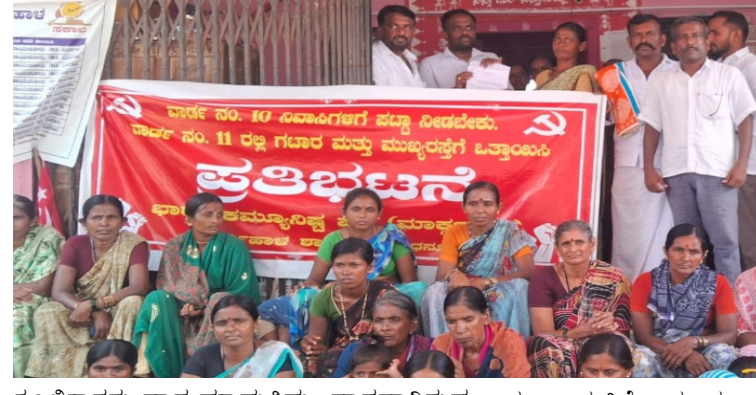
ಕೂಲಿಕಾರರು ವಾಸ ಮಾಡುತ್ತಿದ್ದು, ವಾಸವಾಗಿರುವ ಪಂಚಾಯತಿಗೆ ಹಲವು ಬಾರಿ ಮೌಖಿಕವಾಗಿ ಸ್ಥಳಕ್ಕೆ ಪಟ್ಟಾ ನೀಡುವಂತೆ ಶಾಸಕರಲ್ಲಿ ಮತ್ತು ಪಟ್ಟಣ ಹಾಗೂ ಮನವಿ ಪತ್ರ ಸಲ್ಲಿಸಿದರು ಇದೂವರೆಗೂ

ನೈಜ್ಯ ದೇಶ ನ್ಯೂಸ್ ತುರ್ವಿಹಾಳ ವಾರ್ಡ್ ನಂ-10ರಲ್ಲಿ ವಾಸವಿರುವ ನಿವಾಸಿಗಳಿಗೆ ಪಟ್ಟಾ ನೀಡಬೇಕು. ಕುಷ್ಠಗಿ ಮುಖ್ಯ ರಸ್ತೆಯ ಪಕ್ಕದಲ್ಲಿ ವಾಸಿಸುವ ಜನರಿಗೆ ಕುಡಿಯುವ ನೀರು, ಹಾಗೂ ಶೌಚಾಲಯದ ವ್ಯವಸ್ಥೆಯನ್ನು ಕಲ್ಪಿಸಲು ಒತ್ತಾಯಿಸಿ, ಇಂದು ತುರ್ವಿಹಾಳ ಪಟ್ಟಣ ಪಂಚಾಯತಿ ಅಧ್ಯಕ್ಷರಿಗೆ ಹಾಗೂ ಮುಖ್ಯಾಧಿಕಾರಿಗಳಿಗೆ 10ನೇ ವಾರ್ಡಿನ ನಿವಾಸಿಗಳು ಮನವಿ ಪತ್ರ ಸಲ್ಲಿಸಿದರು. ತಾಲೂಕಿನ ತುರ್ವಿಹಾಳ ಪಟ್ಟಣದ ವಾರ್ಡ್ ನಂ-10 ರಲ್ಲಿ 20 ವರ್ಷಗಳಿಂದ ಕೃಷಿ