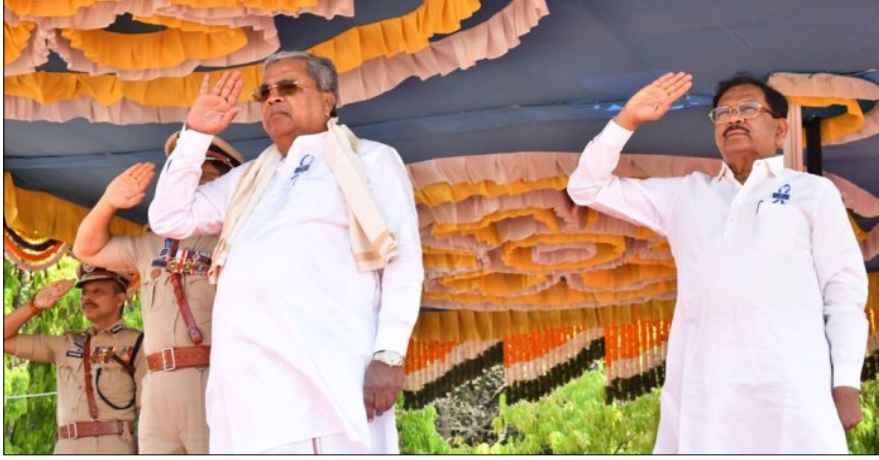
ಬೆಂಗಳೂರು ಪೊಲೀಸ್ ಇಲಾಖೆ ಉತ್ತಮ ಕೆಲಸ ಮಾಡಿದೆ ಎಂದು ಅವರು ಮೆಚ್ಚುಗೆ ವ್ಯಕ್ತಪಡಿಸಿದರು. ಕೇಂದ್ರ ಗೃಹ ಇಲಾಖೆಯು ರಾಯಚೂರು ಜಿಲ್ಲೆಯ ಕವಿತಾ ಪೋಲೀಸ್ ಠಾಣೆ ದೇಶದ 3ನೇ ಅತ್ಯುತ್ತಮ ಪೋಲೀಸ್ ಠಾಣೆ ಎಂದು ಗುರುತಿಸಿದೆ. ಮುಂದಿನ ದಿನಗಳಲ್ಲಿ ರಾಜ್ಯದ ಎಲ್ಲ ಪೋಲೀಸ್ ಠಾಣೆಗಳು, ಕವಿತಾ ಪೋಲೀಸ್ ಠಾಣೆಯಂತೆಯೇ ಅತ್ಯುತ್ತಮ ಪೋಲೀಸ್ ಠಾಣೆಗಳಾಗಬೇಕೆಂದು ಸರ್ಕಾರ ಬಯಸುತ್ತದೆ ಎಂದರು. ಪೋಲೀಸ್ ಇಲಾಖೆಯು ಪ್ರತಿನಿತ್ಯ ಸವಾಲುಗಳನ್ನು ಎದುರಿಸುತ್ತದೆ. ಸವಾಲುಗಳ ಮಧ್ಯೆ

ಬೆಂಗಳೂರು: ಬಹಳ ವರ್ಷಗಳ ಹಿಂದೆಯೇ ಆಂಟಿ ನಕ್ಷಲ್ ಪೋಲೀಸ್ ಸ್ಟಾಪಿಸುವ ಮೂಲಕ ದೇಶದಲ್ಲೇ ಮೊದಲು ಕರ್ನಾಟಕವನ್ನು ನಾವು ನಕ್ಷಲ್ ಮುಕ್ತ ರಾಜ್ಯವನ್ನಾಗಿ ಮಾಡಿದ್ದೇವೆ ಎಂದು ಗೃಹ ಸಚಿವರಾದ ಡಾ. ಬಿ.ಪರಮೇಶ್ವರ್ ಹೇಳಿದರು. ಕೋರಮಂಗಲದ ಕೆಎಸ್ಆರ್‌ಪಿ ಪರೇಡ್ ಮೈದಾನದಲ್ಲಿ ನಡೆದ ಪೋಲೀಸ್ ಧ್ವಜ ದಿನಾಚರಣೆ ಹಾಗೂ ಮುಖ್ಯಮಂತ್ರಿಗಳ ಪದಕ ಪ್ರದಾನ ಕಾರ್ಯಕ್ರಮದಲ್ಲಿ ಪಾಲ್ಗೊಂಡು, ಪದಕ ಪುಸ್ತಕವನ್ನು ಉದ್ದೇಶಿಸಿ ಮಾತನಾಡಿದ ಅವರು, ಕೇಂದ್ರ ಗೃಹಸಚಿವರು ದೇಶವನ್ನು ನಕ್ಷಲ್ ಮುಕ್ತ ಮಾಡಿದ್ದೇವೆ ಎಂದು ಹೇಳಿದ್ದಾರೆ. ಆದರೆ ಮೊದಲು ನಕ್ಷಲ್ ಮುಕ್ತ ರಾಜ್ಯ ಮಾಡಿದ್ದು ನಾವು ಎಂದರು. ಕರ್ನಾಟಕ ಪೋಲೀಸ್ ಇಲಾಖೆ ದೇಶದಲ್ಲೇ ಅತ್ಯಂತ ಉತ್ತಮವಾದ ಪೋಲೀಸ್ ವ್ಯವಸ್ಥೆ ಎಂಬ ಬಿರುದಿಗೆ ಪಾತ್ರವಾಗಿದೆ. 1965ರ ಏ.2ರಂದು ಪೋಲೀಸ್ ಕಾಯ್ದೆಯನ್ನು ಜಾರಿಗೊಳಿಸುವ ಮೂಲಕ ರಾಜ್ಯ ಪೋಲೀಸರನ್ನು ಒಟ್ಟುಗೂಡಿಸಿ, ಶಿಸ್ತಿನಿಂದ ನಡೆಸುವ ಸಂದರ್ಭವನ್ನು ಪೋಲೀಸ್ ಧ್ವಜ ದಿನವನ್ನಾಗಿ ಆಚರಿಸಲಾಗುತ್ತಿದೆ ಎಂದು ಹೇಳಿದರು. ರಾಜ್ಯದಲ್ಲಿ ಶಾಂತಿ, ನೆಮ್ಮದಿ, ಕಾನೂನು ಮತ್ತು ಸುವ್ಯವಸ್ಥೆ ಕಾಪಾಡುವಲ್ಲಿ ಪೋಲೀಸರು ಯಶಸ್ವಿಯಾಗಿದ್ದಾರೆ. ಇಂದಿಯಾ ಜಸ್ಟೀಸ್ ವರದಿ ಪ್ರಕಾರ ದೇಶದಲ್ಲಿ ನೊಂದವರಿಗೆ ನ್ಯಾಯ ನೀಡುವುದರಲ್ಲಿ ಕರ್ನಾಟಕ ಮೊದಲ ಸ್ಥಾನದಲ್ಲಿವೆ ಎಂಬುದು ಗೊತ್ತಾಗಿದೆ. ವಿಶೇಷವಾಗಿ ನ್ಯಾಯ