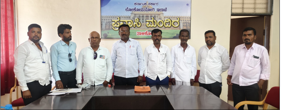
ಇಲಾಖೆ ಮುದ್ದೇಬಿಹಾಳ ಹಾಗೂ ಪುರಸಭೆ ಅಳಿಕೋಟೆ ಇವರ ಸಂಯುಕ್ತ ಆಶ್ರಯದಲ್ಲಿ ಏಪ್ರಿಲ್ 5 ರಂದು ಆಚರಿಸಿರುವ ಡಾ.ಬಾಬು ಅಲೂಕು ಪಂಚಾಯತ್, ಸಮಾಜ ಕಲ್ಯಾಣ ಜಗಜೀವನ ರಾಮ್ ಜಯಂತಿಯನ್ನು