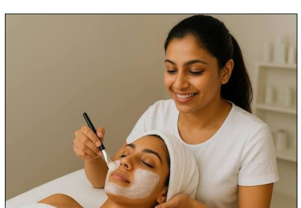
ಪ್ರಾರಂಭವಾಗಿ 35ದಿನಗಳ ಕಾಲ ನಡೆಯಲಿದೆ. ತರಬೇತಿಯ ಅವಧಿಯಲ್ಲಿ

ರಾಯಚೂರು: ಸ್ಟೇಟ್ ಬ್ಯಾಂಕ್ ಆಫ್ ಇಂಡಿಯಾ. ಗ್ರಾಮೀಣ ಸ್ವಯಂ ಉದ್ಯೋಗ ತರಬೇತಿ ಸಂಸ್ಥೆ (ಆರ್ ಸೇಟಿ) ಇವರ ವತಿಯಿಂದ ಗ್ರಾಮೀಣ ನಿರುದ್ಯೋಗಿ ಮಹಿಳೆಯರಿಗಾಗಿ ಜೂನಿಯರ್ ಬ್ಯೂಟಿ ಪ್ರಾಕ್ಟೀಷನರ್ ತರಬೇತಿಗಾಗಿ ಅರ್ಜಿ ಅಭ್ಯರ್ಥಿಗಳಿಂದ ಅರ್ಜಿ ಆಹ್ವಾನಿಸಲಾಗಿದೆ. ತರಬೇತಿಯು 2026ರ ಏಪ್ರಿಲ್ 10ರಿಂದ