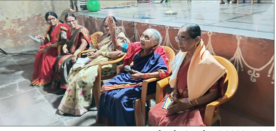
ತಾಳಿಕೋಟೆ: ಮಹಾದೇವಿಯುಕ್ತನವರು ಅಪ್ರತಿಮ ವಚನಕಾರ್ತಿಯಾಗಿದ್ದು ಅವರ ವಚನಗಳಲ್ಲಿ