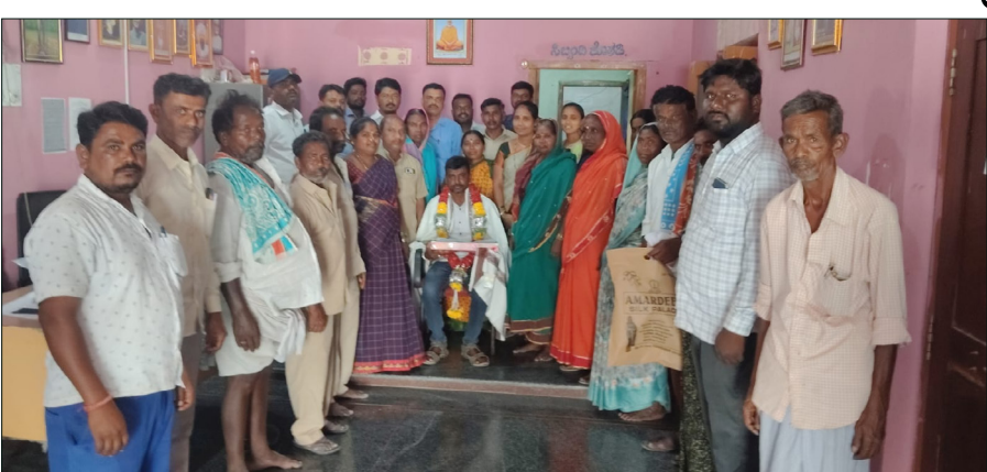
ರಿಗಳಲ್ಲಿ ಸಾಮಾನ್ಯವಾಗಿ ಕಡತಗಳು ಮಾತ್ರ ಮಾತಾಡುತ್ತವೆ,ಆದರೆ ಇಲ್ಲಿ ಮನಸ್ಸುಗಳು ಮಾತಾಡಿದವು. ಬಳಗಾನೂರಿನ ಪಟ್ಟಣ ಪಂಚಾಯ್ತಿಯಲ್ಲಿ