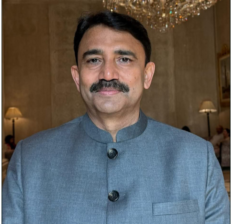
ವ್ಯವಸ್ಥೆ ರೂಪಿಸುವ ಉದ್ದೇಶ ಮಹತ್ವದ್ದೇ. ಆದರೆ ಅದರ ಜಾರಿ ಪಾರದರ್ಶಕವಾಗಿಯೂ ಸಮಾವೇಶಾತ್ಮಕವಾಗಿಯೂ ಇರಬೇಕು. APAAR ಸ್ವಯಂಪ್ರೇರಿತ ಎಂಬುದನ್ನು ಪೋಷಕರಿಗೆ ಸ್ಪಷ್ಟವಾಗಿ ತಿಳಿಸಬೇಕು. ತಾಂತ್ರಿಕ