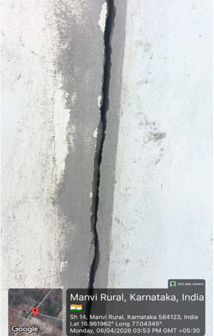
Manvi Rural, Karnataka, India. SH 14, Manvi Rural, Karnataka 584123, India. Lat 15.961962° Long 77.043457° Monday, 05/04/2026 03:53 PM GMT +05:30