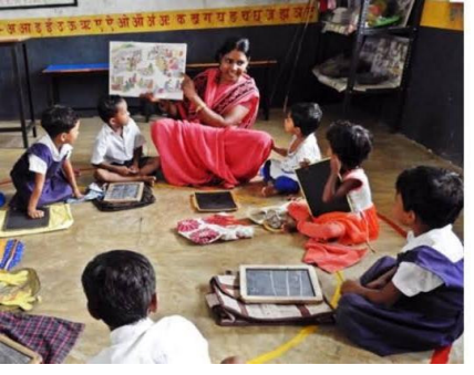
ತಾತ್ಕಾಲಿಕ ಆಯ್ಕೆ ಪಟ್ಟಿಯನ್ನು ಪ್ರಕಟಿಸಲಾಗಿದೆ.

ರಾಯಚೂರು: ರಾಯಚೂರು ಜಿಲ್ಲೆಯ ಮಾನವಿ ಶಿಶು ಅಭಿವೃದ್ಧಿ ಯೋಜನೆ ವ್ಯಾಪ್ತಿಯ 06 ಅಂಗನವಾಡಿ ಕಾರ್ಯಕರ್ತೆ ಮತ್ತು 44 ಸಹಾಯಕಿಯರ ಖಾಲಿ ಹುದ್ದೆಗಳನ್ನು ಭರ್ತಿ ಮಾಡಲು ಆನ್‌ಲೈನ್ ಮುಖಾಂತರ ಈಗಾಗಲೇ ಅರ್ಜಿಗಳನ್ನು ಅಪ್‌ಲೋಡ್ ಮಾಡಿ ಆ-ರಂತೆ ಈ ಹುದ್ದೆಗಳಿಗೆ ಅರ್ಜಿ ಅಭ್ಯರ್ಥಿಗಳ ತಾತ್ಕಾಲಿಕವಾಗಿ ಆಯ್ಕೆ ಮಾಡಿರುವುದರಿಂದ