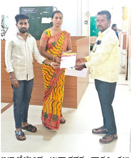
ಈ ಹಿಂದೆ ಪ್ರವಾಸೋದ್ಯಮ ಇಲಾಖೆಯಿಂದ ಉದ್ಘಾಟನಾ ಹಾಗೂ ಕಲ್ಪು