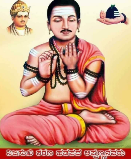
ನಿಜನಿಖಿ ಶಿರಣಿ ಹಡಪದ ಅಪ್ಪಣ್ಣನವರಿ

ನೈಜ್ಯ ದೆಸೆ ನ್ಯೂಸ್: ಏಪ್ರಿಲ್ 7 ರಂದು ಬಸವಕಲ್ಯಾಣ ದಲ್ಲಿ ಇರುವ ಬಿ.ಕೆ.ಡಿ.ಬಿ ಆಯುಕ್ತರ ವಿರುದ್ಧ ಬೃಹತ್ ಹೋರಾಟಕ್ಕೆ ಹೆಚ್ಚಿನ ಜನಸಂಖ್ಯೆಯಲ್ಲಿ ಜನತೆ ಭಾಗವಹಿಸಿ. *ಬೀದರ:- ಜಿಲ್ಲೆಯ ಬಸವಕಲ್ಯಾಣದಲ್ಲಿರುವ ಬಸವಣ್ಣನವರ ಅರಿವಿನ ಮನೆ ಗವಿಯ ಪಕ್ಕದಲ್ಲಿ ಹಡಪದ ಅಪ್ಪಣನವರ ಗವಿಯಲ್ಲಿ ಅವರದ್ದೇ ಮೂರ್ತಿ ಸ್ಥಾಪನೆಗಾಗಿಲೇಕು ಎಂಬುದು ಸಮಾಜದ ದೀರ್ಘಕಾಲದ ಮತ್ತು ನ್ಯಾಯಸಮ್ಮತವಾದ ಬೇಡಿಕೆಯಾಗಿದೆ. ಈ ಕುರಿತ ಇತ್ತೀಚಿನ ಪ್ರಮುಖ ಅಂಶಗಳು ಇಲ್ಲಿವೆ: ವಿವಾದದ ಹಿನ್ನೆಲೆ: ಇತ್ತೀಚೆಗೆ ಹಡಪದ ಅಪ್ಪಣನವರ ಗವಿಯಲ್ಲಿ ಅನ್ಯ ಮೂರ್ತಿಗಳನ್ನು ಸ್ಥಾಪಿಸಲಾಗಿದೆ ಎಂಬ ವಿಷಯ ಸಮಾಜದಲ್ಲಿ ಆಕ್ರೋಶಕ್ಕೆ ಕಾರಣವಾಗಿದೆ. ಸಮಾಜದ ಎಚ್ಚರಿಕೆ: ಗವಿಯಲ್ಲಿ ಪ್ರತಿಷ್ಠಾಪಿಸಲಾಗಿರುವ ಅನ್ಯ ಮೂರ್ತಿಗಳನ್ನು ತಕ್ಷಣವೇ ತೆರವುಗೊಳಿಸಿ, ಅಲ್ಲಿ ಹಡಪದ ಅಪ್ಪಣನವರ ಮೂರ್ತಿಯನ್ನೇ ಸ್ಥಾಪಿಸಬೇಕು. ಇಲ್ಲದಿದ್ದರೆ ಇದೇ ಏಪ್ರಿಲ್ 7ರಂದು ಬೆಳಿಗ್ಗೆ 10:30 ನಿಮಿಷಕ್ಕೆ ಬಿಕ್ಕಿಡಿಬಿ ಅಪೀಸ್ ಅದರುಗಡೆ ಸಮಾಜ ಬಂಧುಗಳ ಸಮ್ಮುಖದಲ್ಲಿ ಉಗ್ರ ಹೋರಾಟ ಮಾಡಲಾಗುವುದು. ಎಂಬುದು ಬೀದರ ಜಿಲ್ಲೆಯ ಹಾಗೂ ಬಸವಕಲ್ಯಾಣ ತಾಲೂಕು ಹಡಪದ ಅಪ್ಪಣ್ಣ ಸಮಾಜದ ಮುಖಂಡರು ಬಿಕ್ಕಿಡಿಬಿ