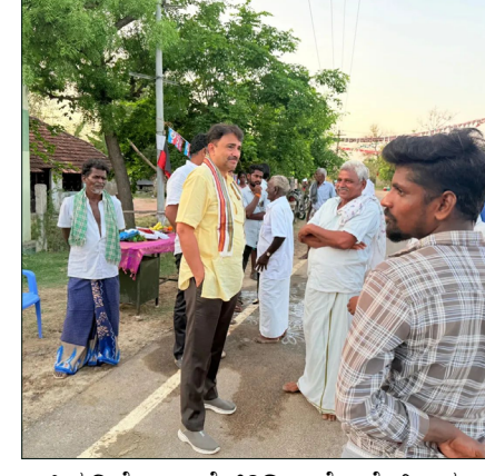
ಅಭಿವೃದ್ಧಿಗೆ ಕಾಂಗ್ರೆಸ್ ಡಿಎಂಕೆ ಮೈತ್ರಿ ಸದಾ ಬದ್ಧವಾಗಿದೆ ಎಂದು ತಿಳಿಸಿದರು. ರಾಜ್ಯ ಮತ್ತು ಕೇಂದ್ರ ಮಟ್ಟದಲ್ಲಿ ಜನರ ಹಿತಾಸಕ್ತಿಯನ್ನು

ಕಾಪಾಡುವ ಶಕ್ತಿಯಾಗಿ ಮೈತ್ರಿ ಪಕ್ಷಗಳು ಕಾರ್ಯನಿರ್ವಹಿಸುತ್ತಿವೆ ಎಂದು ಹೇಳಿದರು. ಪ್ರಚಾರ ವೇಳೆ ಮಹಿಳೆಯರು, ಯುವಕರು ಹಾಗೂ ರೈತರು ಹೆಚ್ಚಿನ ಸಂಖ್ಯೆಯಲ್ಲಿ ಪಾಲ್ಗೊಂಡು ಅಭ್ಯರ್ಥಿಗೆ ಬೆಂಬಲ ಸೂಚಿಸಿದರು. ಕಾರ್ಯಕರ್ತರು ಘೋಷಣೆ ಕೂಗಿ ಉತ್ಸಾಹಭರಿತ ವಾತಾವರಣ ನಿರ್ಮಿಸಿದರು. ಈ ಸಂದರ್ಭದಲ್ಲಿ ಇಂಡಿಯನ್ ನ್ಯಾಷನಲ್ ಕಾಂಗ್ರೆಸ್ ಹಾಗೂ ದ್ರಾವಿಡ ಮುನ್ನೇತೃ ಕಳಘಂ ಪಕ್ಷದ ಜಿಲ್ಲಾ ಮುಖಂಡರು, ಬ್ರಾಕ್ ಅಧ್ಯಕ್ಷರು, ಸ್ಥಳೀಯ ನಾಯಕರು ಹಾಗೂ ಅಪಾರ ಸಂಖ್ಯೆಯ ಸಾರ್ವಜನಿಕರು ಉಪಸ್ಥಿತರಿದ್ದರು. ಚುನಾವಣೆಯಲ್ಲಿ ಮೈತ್ರಿ ಅಭ್ಯರ್ಥಿ ಭರ್ಜರಿ ಜಯ ಸಾಧಿಸಲಿದ್ದಾರೆ ಎಂಬ ವಿಶ್ವಾಸವನ್ನು ನಾಯಕರು ವ್ಯಕ್ತಪಡಿಸಿದರು.