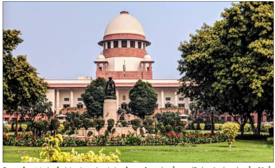
ಡಿಎ ಘೋಷಿಸಿದ್ದ ಕೇರಳ ಸರ್ಕಾರ ಮತ್ತು ಕೆ-ಎಸ್‌ಆರ್‌ಟಿಸಿ (KSRTC) ಸಲ್ಲಿಸಿದ್ದ ಅರ್ಜಿಯನ್ನು ನ್ಯಾಯಮೂರ್ತಿ ಮನೋಜ್ ಮಿಶ್ರಾ ಮತ್ತು ಪ್ರಸನ್ನ ಕಾರಣಕ್ಕೆ ನಿವೃತ್ತ ನೌಕರರ ಹಕ್ಕನ್ನು ಕಸಿದುಕೊಳ್ಳಲು

ನವದೆಹಲಿ: ತುಟ್ಟಭತ್ಯೆ (DA) ಮತ್ತು ತುಟ್ಟ ಪರಿಹಾರ (DR) ಹೆಚ್ಚಳ ಮಾಡುವಾಗ ಹಾಲಿ ನೌಕರರು ಮತ್ತು ನಿವೃತ್ತ ನೌಕರರ (Pensioners) ನಡುವೆ ಸರ್ಕಾರ ತಾರತಮ್ಯ ಮಾಡುವಂತಿಲ್ಲ ಎಂದು ಸುಪ್ರೀಂ ಕೋರ್ಟ್ ಇಂದು (ಏಪ್ರಿಲ್ 10, 2026) ಐತಿಹಾಸಿಕ ತೀರ್ಪು ನೀಡಿದೆ. "ಜಿಲೆ ಏಂಕಿಯು ಹೊಡೆತವು ನೌಕರರಿಗೆ ಮತ್ತು ನಿವೃತ್ತ ನೌಕರರಿಗೆ ಸಮಾನವಾಗಿಯೇ ಇರುತ್ತದೆ" ಎಂದು ನ್ಯಾಯಾಲಯ ಈ ವೇಳೆ ಅಭಿಪ್ರಾಯಪಟ್ಟಿದೆ. ಸಂವಿಧಾನದ 14ನೇ ವಿಧಿಯಡಿ (ಸಮಾನತೆಯ ಹಕ್ಕು) ಎಲ್ಲರಿಗೂ ಸಮಾನ ರಕ್ಷಣೆ ಇರಬೇಕು. ನೌಕರರಿಗೆ ಹೆಚ್ಚಿನ ದರದಲ್ಲಿ ಡಿಎ ನೀಡಿ, ಪೆನ್ಷನರ್‌ಗಳಿಗೆ ಕಡಿಮೆ ದರದಲ್ಲಿ ತುಟ್ಟ ಪರಿಹಾರ ನೀಡುವುದು ಕಾನೂನುಬಾಹಿರ ಮತ್ತು ಸ್ವೇಚ್ಛಾಚಾರದ ನಡವಳಿಕೆ ಎಂದು ಕೋರ್ಟ್ ಹೇಳಿದೆ. ನೌಕರರಿಗೆ 14% ಮತ್ತು ಪೆನ್ಷನರ್‌ಗಳಿಗೆ ಕೇವಲ 11%