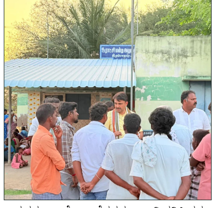
ಜನಪರ ಯೋಜನೆಗಳನ್ನು ವಿವರಿಸಿದರು. ಸಭೆಯಲ್ಲಿ ಮಾತನಾಡಿದ ಅವರು, ಶಿಕ್ಷಣ, ಆರೋಗ್ಯ, ಕೃಷಿ ಹಾಗೂ ಮೂಲಸೌಕರ್ಯ