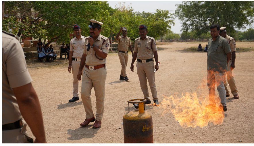
ಅಫ್ ಮಾಡಿ. ಎಲ್.ಪಿ.ಜಿ ಗ್ಯಾಸ್ ಸೋರಿಕೆಯಾಗುತ್ತಿದ್ದರೆ ತಕ್ಷಣ ರೆಗ್ಯುಲೇಟರ್ ಅಫ್ ಮಾಡಿ ಕಿಟಕಿ.ಬಾಗಿಲುಗಳನ್ನು ತೆರೆಯಿರಿ. ಬಿಸಿಲು ಹೆಚ್ಚಿರುವ ಜಿಲ್ಲೆಗಳಲ್ಲಿ ಒಣ ಕಸ ಅಥವಾ ಹುಲ್ಲಿನ ಬಣವೆಗಳ ಬಳಿ ಬೆಂಕಿ ಹಚ್ಚುವಾಗ ಹೆಚ್ಚಿನ ನಿಗಾವಹಿಸಬೇಕು. ಅಗ್ನಿ ಅವಘಡ ಸಂಭವಿಸಿದ ಮೊದಲ ಕೆಲವೇ ನಿಮಿಷಗಳು ಅತ್ಯಂತ ನಿರ್ಣಾಯಕವಾಗಿರುವುದರಿಂದ ಈ ಸಮಯವನ್ನು ಬಂಗಾರದ ಸಮಯ ಎಂದು ಕರೆಯಲಾಗುತ್ತದೆ ಈ ಸಮಯದಲ್ಲಿ ಬೆಂಕಿ ಹರಡದಂತೆ ಸೂಕ್ತ ಕ್ರಮವನ್ನು ಕೈಗೊಂಡಲ್ಲಿ ಅಮೂಲ್ಯವಾದ ಜೀವ ಮತ್ತು ಆಸ್ತಿ ಹಾನಿಯನ್ನು ತಡೆಗಟ್ಟಬಹುದು ಸುರಕ್ಷತೆ ಎನ್ನುವುದು ಕೇವಲ ಅಗ್ನಿಶಾಮಕ ದಳದ