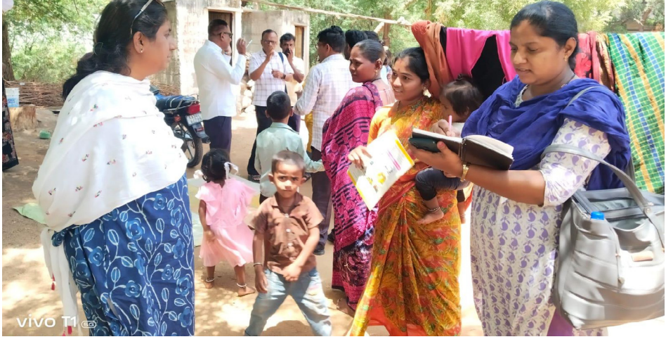
ಹೆಣ್ಣು ಮಕ್ಕಳ ಜೀವನದಲ್ಲಿ ಗಂಭೀರ ಆರೋಗ್ಯ ಸಮಸ್ಯೆಯನ್ನುಂಟು ಮಾಡುವ ಗರ್ಭಕಂಠದ ಕ್ಯಾನ್ಸರ್ ತಡೆಗೆ ಹೆಚ್‌ಪಿವಿ ಲಸಿಕೆ ಅತ್ಯಂತ ಉಪಯುಕ್ತವಾಗಿದ್ದು, ಈಗಾಗಲೇ ಲಸಿಕೆಯನ್ನು ಹಾಕಲಾಗುತ್ತಿದ್ದು, ದಯವಿಟ್ಟು ಅನಗತ್ಯ ತಪ್ಪು ಮಾಹಿತಿಗಳಿಗೆ ಕಿವಿಗೊಡದೆ, 14 ವರ್ಷದ ಹೆಣ್ಣು ಮಕ್ಕಳಿಗೆ ಉಚಿತ ಹೆಚ್.ಪಿ.ವಿ (ಹುಮಾನ್ ಪ್ಯಾಪಿಲೋಮ ವೈರಸ್) ವಿರುದ್ಧದ ಲಸಿಕೆ ಹಾಕಿಸಬೇಕೆಂದರು. ಗರ್ಭಕಂಠದ ಕ್ಯಾನ್ಸರ್‌ಗೆ ಕಾರಣಗಳು: ಸಾಮಾನ್ಯವಾಗಿ ವೈಯಕ್ತಿಕ ಶುಚಿತ್ವ, ಜನನಾಂಗಗಳಲ್ಲಿ ತೊಂದರೆ, ಹುಣ್ಣು, ಅಸುರಕ್ಷಿತ ಲೈಂಗಿಕ ಸಂಪರ್ಕದಿಂದ ಗರ್ಭಕಂಠದಹೂಮನ್ ಪ್ಯಾಪಿಲೋಮ ವೈರಸ್ (ಹೆಚ್.ಪಿ.ವಿ) ಸೋಂಕು ಕ್ರಮೇಣ ಗರ್ಭಕಂಠದ ಜೀವಕೋಶಗಳಲ್ಲಿ ಬದಲಾವಣೆಗಳಾಗಿ ಕ್ಯಾನ್ಸರ್ ಆಗಿ ಬದಲಾಗುತ್ತದೆ. ಈ ಹಿನ್ನೆಲೆಯಲ್ಲಿ ಮಾರಕವಾಗುವುದನ್ನು ತಡೆಯಲು ಹೆಚ್.ಪಿ.ವಿ ಲಸಿಕೆಯು ಸೂಕ್ತವಾಗಿದೆ ಎಂದು ಜಿಲ್ಲಾ ಆರ್.ಸಿ.ಹೆಚ್. ಅಧಿಕಾರಿ-

ನೈಜ್ಯ ದೆಸೆ ನ್ಯೂಸ್: ರಾಯಚೂರು: ಮಹಿಳೆಯರನ್ನು ಕಾಡುವ ಗರ್ಭಕಂಠದ ಕ್ಯಾನ್ಸರ್ ತಡೆಗಟ್ಟುವಲ್ಲಿ ಎಚ್‌ಪಿವಿ ಲಸಿಕೆ ಅತ್ಯಂತ ಪರಿಣಾಮಕಾರಿಯಾಗಿದೆ. ಅರ್ಹ ವಯಸ್ಸಿಗೆ ಲಸಿಕೆ ಪಡೆದರೆ ಭವಿಷ್ಯದ ಆರೋಗ್ಯಕ್ಕೆ ಭದ್ರತೆ ಸಿಗುತ್ತದೆ ಎಂದು ಜಿಲ್ಲಾ ಆರ್.ಸಿ.ಹೆಚ್. ಅಧಿಕಾರಿಗಳಾದ ಡಾ.ನಂದಿತಾ ಎಮ್.ಎನ್. ಅವರು ಹೇಳಿದರು. ಇತ್ತೀಚೆಗೆ ಜಿಲ್ಲೆಯ ದೇವದುರ್ಗ ತಾಲೂಕಿನ ಕಿರಿಗುಡ್ಡ ಸೇರಿದಂತೆ ಗ್ರಾಮೀಣ ಭಾಗದ ವಿವಿಧ ಹಳ್ಳಿಗಳಿಗೆ ಭೇಟಿ ಹೆಚ್‌ಪಿವಿ ಲಸಿಕೆ ಕಾರ್ಯವನ್ನು ಪರಿಶೀಲಿಸಿ, ಅವರು ಮಾತನಾಡಿದರು. ಈ ಲಸಿಕೆ ಹೊಸದೇನಲ್ಲ, ಜಗತ್ತಿನಾದ್ಯಂತ ಈಗಾಗಲೇ 50 ಕೋಟಿಗೂ ಅಧಿಕ ಲಸಿಕೆಗಳನ್ನು ನೀಡಲಾಗಿದೆ. ಕಳೆದ 15 ವರ್ಷಗಳ ಅಂಕಿ-ಅಂಶಗಳು ಈ ಲಸಿಕೆ ಸುರಕ್ಷಿತ ಮತ್ತು ಪರಿಣಾಮಕಾರಿ ಎಂಬುದನ್ನು ಸಾಬೀತುಪಡಿಸಿವೆ ಎಂದರು. ಸರ್ಕಾರದ ಮಾರ್ಗಸೂಚಿಯಂತೆ 14 ವರ್ಷ ಪೂರೈಸಿದ ಮತ್ತು 15 ವರ್ಷದೊಳಗಿನ ಹೆಣ್ಣು ಮಕ್ಕಳಿಗೆ ಉಚಿತವಾಗಿ ಲಸಿಕೆ ನೀಡಲಾಗುತ್ತಿದೆ. ಸಾರ್ವಜನಿಕರು ಇದರ ಸದುಪಯೋಗ ಪಡೆದುಕೊಳ್ಳಬೇಕು ಎಂದರು. 14 ವರ್ಷದ ಹೆಣ್ಣು ಮಕ್ಕಳಿಗೆ ಹೆಚ್.ಪಿ.ವಿ ಪಾಲಕರು ಯಾವುದೇ ತಪ್ಪು ನಂಬಿಕೆಗಳು, ಸಾಮಾಜಿಕ ಜಾಲತಾಣಗಳಲ್ಲಿ ವೈಜ್ಞಾನಿಕವಾಗಿ ಗೊತ್ತಿಲ್ಲದ ಕೆಲವರು ಹರಡುವ ಸುಳ್ಳು ಸುದ್ದಿಗಳನ್ನು ನಂಬದೆ, ಯಾವುದೇ ಹಿಂದೇಟು ಹಾಕದೆ ಭವಿಷ್ಯದಲ್ಲಿ ಹೆಣ್ಣು ಮಕ್ಕಳನ್ನು ಗರ್ಭಕಂಠದ ಕ್ಯಾನ್ಸರ್‌ನಿಂದ ದೂರವಿರಿಸಲು ಎಲ್ಲ ಪಾಲಕರು ಮುಂದೆ ಬರಬೇಕು ಎಂದರು.