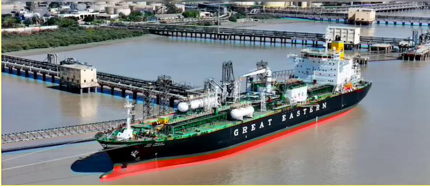
ಅಹಮದಾಬಾದ್: ಪಶ್ಚಿಮ ಏಷ್ಯಾದಲ್ಲಿನ ಉದ್ದಿಗತೆಯ ನಡುವೆಯೇ, 20,400 ಮೆಟ್ರಿಕ್ ಟನ್ ಪ್ರಮಾಣದ ಪೆಟ್ರೋಲಿಯಂ ಅನಿಲ ಹೊತ್ತು ಭಾರತೀಯ ದ್ವಜ ಹೊತ್ತು ಹಡಗು 'ಜಗ ವಿಕ್ರಮ್' ಗುಜರಾತ್‌ನ ಕಾಂಡ್ವಾದ ದೀನ್‌ದಯಾಳ್ ಬಂದರು ಪ್ರಾಧಿಕಾರಕ್ಕೆ ಆಗಮಿಸಿದೆ ಎಂದು ಅಧಿಕಾರಿಗಳು ತಿಳಿಸಿದ್ದಾರೆ.

ಅಮೆರಿಕ ಮತ್ತು ಇರಾನ್ ನಡುವಿನ ಎರಡು ವಾರಗಳ ತಾತ್ಕಾಲಿಕ ಕಡನ ವಿರಾಮದ ನಂತರ ಹಡಗು ಹಾರ್ಮುಜ್ ಜಲಸಂಧಿಯನ್ನು ದಾಟಿ ಮಂಗಳವಾರ ರಾತ್ರಿ ಕಚ್ಚನ್ ಡಿಪಿಎ ಕಾಂಡ್ವಾದ ಆಯಲ್ ಜೆಟ್ಟ್-1 ನಲ್ಲಿ ಲಂಗರು ಹಾಕಲಾಗಿದೆ ಎಂದು ಪ್ರಾಧಿಕಾರ ಹೇಳಿಕೆಯಲ್ಲಿ ತಿಳಿಸಿದ್ದಾರೆ.