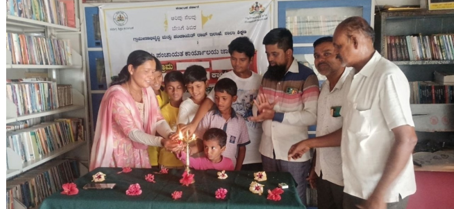
ಇಲ್ಲಿ ಸಿಗುತ್ತವೆ. ಅತಿ ಹೆಚ್ಚಿನ ಜ್ಞಾನ ಸಂಪಾದನೆಗೆ ವಿದ್ಯಾರ್ಥಿಗಳಿಗೆ ಪುಸ್ತಕಗಳೇ ಕಾರಣವಾದ್ದರಿಂದ ವಿದ್ಯಾರ್ಥಿಗಳು ಬೇಸಿಗೆಯಲ್ಲಿ ಎಲ್ಲಿಯೂ ಕೂಡ ತಿರುಗಾಡದೆ, ಸಮಯವನ್ನು ವ್ಯರ್ಥ ಮಾಡದೆ, ತಾಲೂಕು ಕಾಲೇಜುಗಳು ರಜಾ ಇರುವುದರಿಂದ ವಿದ್ಯಾರ್ಥಿಗಳಿಗೆ ಹೆಚ್ಚಿನ ಅಭ್ಯಾಸಕ್ಕೆ ನೆರವಾಗಲು ಈ ವಿಶೇಷ ಕಾರ್ಯಕ್ರಮವಾದ ಅರಿವು-ನೆರವು ಮೂಲಕ ಓದುಗರನ್ನು ಸೆಳೆಯುವ ಪ್ರಯತ್ನ ಮಾಡುತ್ತಿದ್ದೇವೆ. ಈ ಕೇಂದ್ರ ಗ್ರಂಥಾಲಯವನ್ನು ಸದುಪಯೋಗ ಪಡೆದುಕೊಳ್ಳಬೇಕು ಎಂದರು.