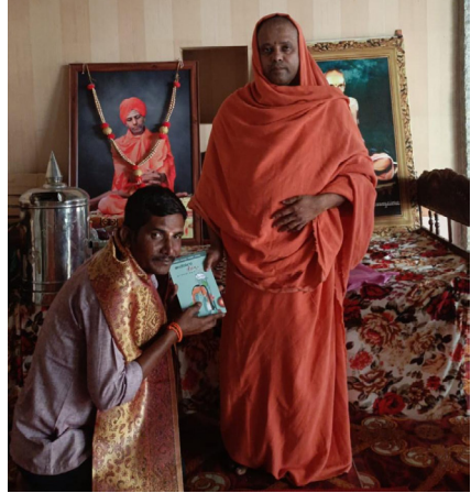
ರೈತರ ಮತ್ತು ವಿವಿಧ ಇಲಾಖೆಯ ಅಧಿಕಾರಿಗಳ