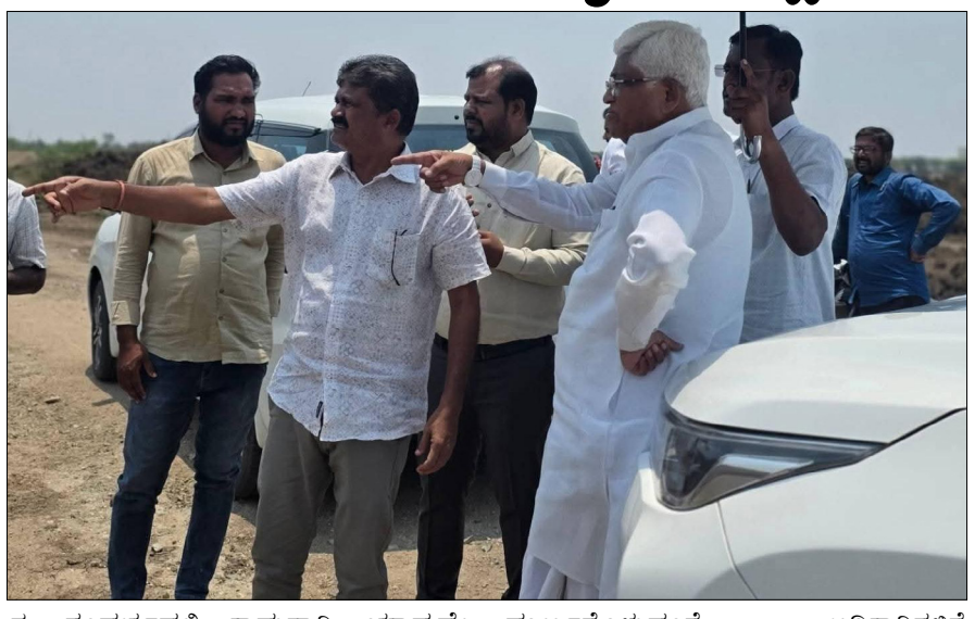
ಈ ಸಂದರ್ಭದಲ್ಲಿ ಕಾಮಗಾರಿ ಯಾವುದೇ ಪೂರ್ಣಗೊಳ್ಳುವಂತೆ ಅಧಿಕಾರಿಗಳಿಗೆ ವಿಳಂಬವಿಲ್ಲದೆ ತುರ್ತು ಗತಿಯಲ್ಲಿ ಕಟ್ಟುನಿಟ್ಟಿನ ಸೂಚನೆ ನೀಡಲಾಯಿತು.