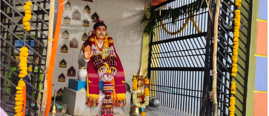
ರಾಯಚೂರು: ಜಿಲ್ಲೆಯ ಲಿಂಗಸಗೂರು ತಾಲೂಕಿನ ಸಮೀಪದ ವಂದಲಿ ಹೊಸೂರು ಗ್ರಾಮದಲ್ಲಿರುವ ಶ್ರೀ ಕ್ಷೇತ್ರದಲ್ಲಿ ಇಂದು ಬೆಳಗಿನ ಜಾವ ಬ್ರಾಹ್ಮಿ