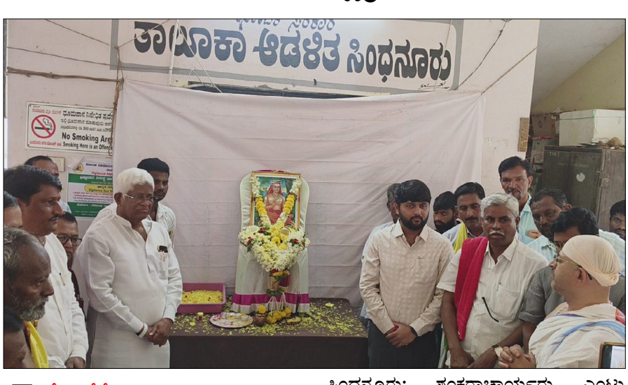
ಸಿಂಧನೂರು: ಶಂಕರಾಚಾರ್ಯರು ಎಂಟು ವರ್ಷದವರಿಗಾಗಲೇ ನಾಲ್ಕು ವೇದಗಳನ್ನು