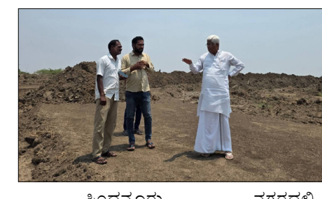
ಸಿಂಧನೂರು ನಗರದಲ್ಲಿ ವರ್ಷಗಳಿಂದ ಎದುರಾಗುತ್ತಿರುವ ಕುಡಿಯುವ ನೀರಿನ ಸಮಸ್ಯೆಗೆ ಶಾಶ್ವತ ಪರಿಹಾರ ಒದಗಿಸುವ ದಿಶೆಯಲ್ಲಿ ಈ ಯೋಜನೆ ಪ್ರಮುಖ ಮೈಲಿಗಲ್ಲಾಗಿದೆ ಎಂದು ತಿಳಿಸಲಾಯಿತು. ಜನಸಾಮಾನ್ಯರ ಮೂಲಭೂತ ಅಗತ್ಯಗಳಾದ ನೀರು, ಆರೋಗ್ಯ ಮತ್ತು ಅಭಿವೃದ್ಧಿಗೆ ಆನ್ವಿತ ನೀಡುವ ದೃಷ್ಟಿಯಿಂದ ಇಂತಹ ಅಭಿವೃದ್ಧಿ ಕಾಮಗಾರಿಗಳನ್ನು ಹಂತ ಹಂತವಾಗಿ ಜಾರಿಗೆ ತರಲಾಗುತ್ತಿದೆ ಎಂದು ಹೇಳಿದರು.