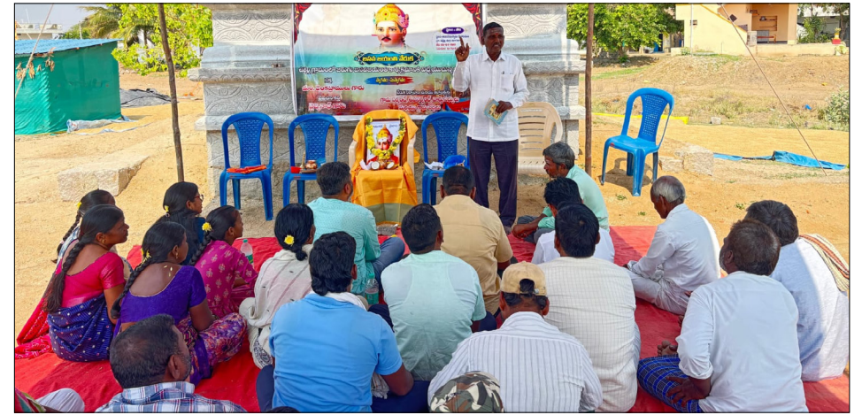
ಕೈಲಾಸವಾಗಿದೆ ಎಂದು ಹೇಳಿದ್ದಾರೆ ಎಂದು ತಿಳಿಸಿದರು. ಕನ್ನಡ ನಾಡಿನ ಏಕೈಕ ಮೇರು ಸಾಧ್ಯತೆ ವ್ಯಕ್ತಿಯಾಗಿದ್ದಾರೆ ಇಂಥವರ ಬಸವಣ್ಣನವರು ಸಾಮಾಜಿಕ, ಆರ್ಥಿಕ, ಧಾರ್ಮಿಕ, ಶೈಕ್ಷಣಿಕ, ಮಹಿಳಾ ಸಮಾನತೆ ಮತ್ತು ಧಾರ್ಮಿಕ-ಸಾಮಾಜಿಕ ಚಿಂತನೆಯ ಸಂಸ್ಥೆ (ಅನುಭವ ಮಂಟಪ) ಸ್ಥಾಪನೆ ಸೇರಿದಂತೆ ಇಂತಹ ಸಾಧನ ಮಾಡಿದ ವಿಶ್ವದ ಏಕೈಕ ವ್ಯಕ್ತಿಯಾಗಿದ್ದಾರೆ ಇಂಥವರ ಹೆಸರನ್ನು ಅಂತಾರಾಷ್ಟ್ರೀಯ ಮಟ್ಟದಲ್ಲಿ ಇಡಬೇಕಾಗಿತ್ತು. ಆದರೆ ದುರದೃಷ್ಟವಶಾತ್ ಇವರ ಹೆಸರನ್ನು ಒಂದು ವಿವಿ ಇಡಲು ಬಿಡದಂತಹ ಕ್ಷುಲ್ಲಕ ಜನತೆ ನಮ್ಮ