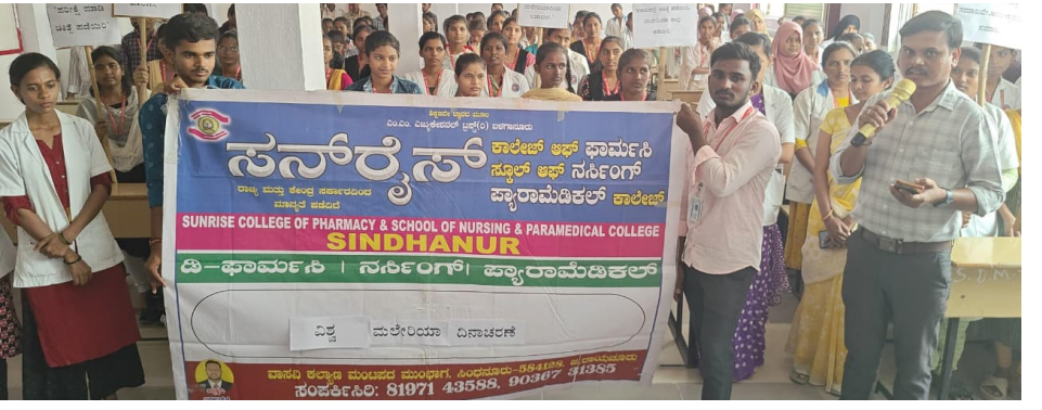
ಜ್ವರ ಕಂಡ ತಕ್ಷಣ ರಕ್ತ ಪರೀಕ್ಷೆ ಮಾಡಿಸಿಕೊಳ್ಳಿ 4. ವೈದ್ಯಕೀಯ ಮುನ್ನೆಚ್ಚರಿಕೆ ಆರೋಗ್ಯ ಇಲಾಖೆಯ ಸೂಚನೆಗಳನ್ನು ಪಾಲಿಸಿ ಉಚಿತ ಮಲೇರಿಯಾ ಪರೀಕ್ಷಾ ಶಿಬಿರಗಳಲ್ಲಿ ಭಾಗವಹಿಸಿ ವೈದ್ಯರ ಸಲಹೆಯಂತೆ ಪೂರ್ಣ ಔಷಧ ಸೇವನೆ ಮಾಡಬೇಕು. ಮಲೇರಿಯಾ ಲಕ್ಷಣಗಳನ್ನು ನಿರ್ಲಕ್ಷಿಸಬೇಡಿ ಏಕೆಂದರೆ ಮಲೇರಿಯಾದಿಂದ ಹಠಾತ್ ಜ್ವರ ಮತ್ತು ನಡುಕ ತಲೆನೋವು ಮತ್ತು ದೇಹ ನೋವು ವಾಂತಿ, ದೌರ್ಬಲ್ಯ ಬೆವರು ಹೆಚ್ಚು ಬರುತ್ತಿರುವುದು ನಂತರ ವಿದ್ಯಾರ್ಥಿಗಳು ಪರಿಸರ ಆರೋಗ್ಯಕರ ಜೀವನ ಎಂಬ

ಸಿಂಧನೂರು: ಸಿಂಧನೂರ್ ನಗರದ ಸನ್ ರೈಸ್ ಡಿ ಫಾರ್ಮಸಿ, ನರ್ಸಿಂಗ್, ಪ್ಯಾರಾಮೆಡಿಕಲ್ ಕಾಲೇಜಿನಲ್ಲಿ ಏಪ್ರಿಲ್ 25ರಂದು ವಿಶ್ವದಾದ್ಯಂತ ಆಚರಿಸಲಾಗುವ ವಿಶ್ವ ಮಲೇರಿಯ ದಿನಾಚರಣೆ ಅಂಗವಾಗಿ ಕಾಲೇಜಿನಲ್ಲಿ ಜಾಗೃತಿ ಕಾರ್ಯಕ್ರಮವನ್ನು ಆಯೋಜಿಸಲಾಯಿತು. ಮಲೇರಿಯಾ ರೋಗದ ತಡೆಗಟ್ಟುವಿಕೆ, ಸ್ವಚ್ಛತೆ ಮತ್ತು ಆರೋಗ್ಯ ಜಾಗೃತಿ ಕುರಿತು ನರ್ಸಿಂಗ್, ಪ್ಯಾರಾಮೆಡಿಕಲ್ ವಿದ್ಯಾರ್ಥಿಗಳಿಗೆ ಅವಿವಿಧ ಮೂಡಿಸುವುದು ಕಾರ್ಯಕ್ರಮದ ಮುಖ್ಯ ಉದ್ದೇಶವಾಗಿತ್ತು. ಕಾರ್ಯಕ್ರಮವನ್ನು ಕಾಲೇಜಿನ ಪ್ರಾಂಶುಪಾಲರು ಉದ್ಘಾಟಿಸಿ ಮಾತನಾಡಿ, ಮಲೇರಿಯಾ ಬಂದು ಸಾಂಕ್ರಾಮಿಕ ರೋಗವಾಗಿದ್ದು ಪರಿಸರ ಸ್ವಚ್ಛತೆ ಮತ್ತು ಸೊಳ್ಳೆ ನಿಯಂತ್ರಣದ ಮೂಲಕವೇ ಇದನ್ನು ತಡೆಗಟ್ಟಬಹುದು ಎಂದು ತಿಳಿಸಿದರು. ಈ ಸಂದರ್ಭದಲ್ಲಿ ವಿದ್ಯಾರ್ಥಿಗಳಿಗೆ ಮಲೇರಿಯಾ ಹರಡುವ ವಿಧಾನ, ಲಕ್ಷಣಗಳು, ಮುನ್ನೆಚ್ಚರಿಕೆ ಕ್ರಮಗಳು ಮತ್ತು ಸಮಯಕ್ಕೆ ಚಿಕಿತ್ಸೆ ಪಡೆಯುವ ಅಗತ್ಯತೆ ಕುರಿತು ಮಾಹಿತಿ ನೀಡಿದರು. ಮಲೇರಿಯಾ ತಡೆಗಟ್ಟುವ ಪ್ರಮುಖ ವಿಧಾನಗಳಾವೆಂದರೆ 1. ಪರಿಸರ ನಿರ್ವಹಣೆ ಮನೆಯ ಸುತ್ತಮುತ್ತ ನೀರು ನಿಲ್ಲದಂತೆ ನೋಡಿಕೊಳ್ಳಬೇಕು ಹೂವಿನ ಕುಂಡ, ಫ್ರಿಜ್ ಟ್ರೇ, ಕುಡಿಯುವ ನೀರಿನ ಪಾತ್ರೆಗಳನ್ನು ನಿಯಮಿತವಾಗಿ ಸ್ವಚ್ಛಗೊಳಿಸಬೇಕು ಮಳೆ ನೀರು ಸಂಗ್ರಹವಾಗುವ ಸ್ಥಳಗಳನ್ನು ಮುಚ್ಚಬೇಕು. ಕಸದ ರಾಶಿ ಮತ್ತು ಮಣ್ಣು ಗುಂಡಿಗಳನ್ನು ತೆರವುಗೊಳಿಸಬೇಕು. 2. ಮನೆಮಟ್ಟದ ರಕ್ಷಣಾ ಕ್ರಮಗಳು ಕಿಟಕಿ ಮತ್ತು ಬಾಗಿಲುಗಳಿಗೆ ಜಾಲಿ ಅಳವಡಿಸಿಕೊಳ್ಳಿ ಮಸ್ಕಿಟೋ ಕಾಯಿಲ್, ಲಿಕ್ವಿಡ್ ರಿಪೆಲ್ಲೆಂಟ್ ಅಥವಾ ಸ್ಟ್ರೆ ಬಳಸಿ ಮಲಗುವಾಗ ಸೊಳ್ಳೆ ಜಾಲ ಬಳಸುವುದು ಅತ್ಯುತ್ತಮ ಕ್ರಮ 3. ವೈಯಕ್ತಿಕ ಆರೋಗ್ಯ ಸುರಕ್ಷತೆ ಸಂಜೆ ನಂತರ ಪೂರ್ಣಬಾಹು ಉಡುಪು ಧರಿಸಿ ಮುಕ್ತಳಿಗೆ ಹಾಗೂ ಗರ್ಭಿಣಿಯರಿಗೆ ವಿಶೇಷ ಜಾಗೃತೆ ವಹಿಸಿ