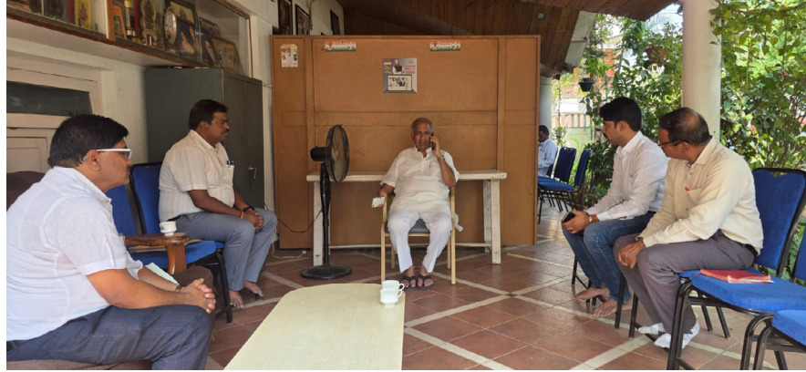
ನಮಾಜ್ ಗೆರಗುಡ್ಡ ಹಾಗೂ ವಿಠಲ್ ನಗರದ ನೀರಿನ ಟ್ಯಾಂಕ್‌ಗಳಿಂದ ಸರಬರಾಜಾಗುವ ವಾರ್ಡ್ ಸಂಖ್ಯೆ 1, 2, 3, 4, 18, 19, 20, 25, 26, 27 ಸೇರಿದಂತೆ ಸುಮಾರು 12 ವಾರ್ಡ್‌ಗಳಿಗೆ ನೀರಿನ ಅಡಚಣೆ ಉಂಟಾಗಿದೆ. ನಿಮ್ಮ ವಿಳಂಬ ನೀತಿಯಿಂದಾಗಿ

ಮಾನ್ವಿ: ನಗರದಲ್ಲಿ ಪದೇ ಪದೇ ಉಂಟಾಗುತ್ತಿರುವ ಕುಡಿಯುವ ನೀರಿನ ವ್ಯತ್ಯಯ ಹಾಗೂ ಕಾಮಗಾರಿಗಳ ವಿಳಂಬ ನೀತಿಯನ್ನು ಖಂಡಿಸಿ, ಸಣ್ಣ ನೀರಾವರಿ ಹಾಗೂ ವಿಜ್ಞಾನ ಮತ್ತು ತಂತ್ರಜ್ಞಾನ ಸಚಿವರು ಹಾಗೂ ವಿಧಾನ ಪರಿಷತ್ತಿನ ಸಭಾ ನಾಯಕರಾದ ಶ್ರೀ ಎನ್.ಎಸ್. ಬೋಸರಾಜು ಅವರು ಅಧಿಕಾರಿಗಳು ಮತ್ತು ಗುತ್ತಿಗೆದಾರರನ್ನು ತೀವ್ರವಾಗಿ ತರಾಟೆಗೆ ತೆಗೆದುಕೊಂಡರು. ಇಂದು ಬೆಳಿಗ್ಗೆ ರಾಯಚೂರಿನ ತಮ್ಮ ನಿವಾಸದಲ್ಲಿ ಹಮ್ಮಿಕೊಂಡಿದ್ದ ತುರ್ತು ಸಭೆಯಲ್ಲಿ, ಮಾನ್ವಿ ನಗರದ ಕುಡಿಯುವ ನೀರಿನ ಸಮಸ್ಯೆಗಳ ಕುರಿತು ಅವರು ಸುದೀರ್ಘ ಚರ್ಚೆ ನಡೆಸಿದರು. ಅಮೃತ್-2 ಮತ್ತು ಜೆ.ಜಿ.ಎಂ (JIM) ಪೈಪ್‌ಲೈನ್ ನಿರ್ವಹಣೆ ಮಾಡುತ್ತಿರುವ ಕಂಪನಿಯ ಗುತ್ತಿಗೆದಾರರು ಹಾಗೂ ಅಧಿಕಾರಿಗಳ ನಿರ್ಲಕ್ಷ್ಯದಿಂದಾಗಿ ಸಾರ್ವಜನಿಕ-ರೀತಿ ತೊಂದರೆಯಾಗುತ್ತಿರುವುದಕ್ಕೆ ಸಚಿವರು ತೀವ್ರ ಆಕ್ರೋಶ ವ್ಯಕ್ತಪಡಿಸಿದರು. ನಗರದ ಮಲ್ಲಿಕಾರ್ಜುನ ಚಿತ್ರಮಂದಿರದ ಮುಂಭಾಗದಿಂದ ಬಸವ ವೃತ್ತದವರೆಗೆ ನಡೆಯುತ್ತಿರುವ ಕಾಮಗಾರಿಯಿಂದಾಗಿ ನಮಾಜ್ ಗೆರಗುಡ್ಡ ಹಾಗೂ ವಿಠಲ್ ನಗರದ ನೀರಿನ ಟ್ಯಾಂಕ್‌ಗಳಿಂದ ಸರಬರಾಜಾಗುವ ವಾರ್ಡ್ ಸಂಖ್ಯೆ 1, 2, 3, 4, 18, 19, 20, 25, 26, 27 ಸೇರಿದಂತೆ ಸುಮಾರು 12 ವಾರ್ಡ್‌ಗಳಿಗೆ ನೀರಿನ ಅಡಚಣೆ ಉಂಟಾಗಿದೆ. ನಿಮ್ಮ ವಿಳಂಬ ನೀತಿಯಿಂದಾಗಿ