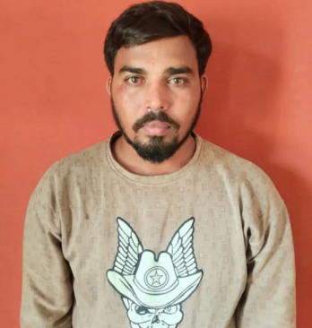
ಕೆಲಸದ ಹುಡುಕಾಟದಲ್ಲಿದ್ದ ಬಡ ಹಾಗೂ ಮಧ್ಯಮ ವರ್ಗದ ಮಹಿಳೆಯರನ್ನು ಗು-ರಿಯಾಗಿಗೊಂಡು ಹೆಚ್ಚಿನ ಸಂಖ್ಯೆ