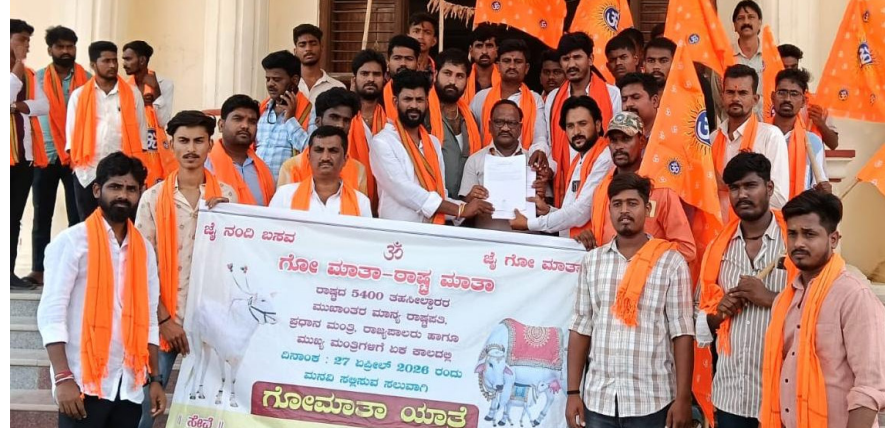
ಶ್ರೀರಾಮ ಸೇನೆ ತಾಲೂಕು ಘಟಕದ ವತಿಯಿಂದ ಮನವಿ ಪತ್ರ ನೀಡುತ್ತಿರುವುದು