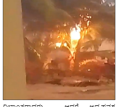
ದಿಬ್ಬಾಂತರಾದರು ಆದರೆ ಅದ್ಭುತವರ ಯಾವುದೇ ರೀತಿಯ ನಷ್ಟ ಹಾನಿ ಸಂಭವಿಸಿಲ್ಲ