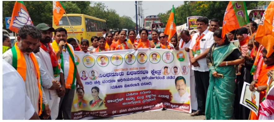
ಅವರು, ಮಹಿಳಾ ಮೀಸಲಾತಿ ಮಸೂದೆ ಧೋರಣೆ ಅನುಸರಿಸಿವೆ. ಈ ದೇಶದ ಚಾರಿಯಾಗದಂತೆ ತಡೆದ ಕಾಂಗ್ರೆಸ್ ಮತ್ತು ಮಹಿಳೆಯರಿಗೆ ಸಿಗುವ ಗೌರವವನ್ನು ಹಾಳು ಅದರ ಮಿತ್ರಪಕ್ಷಗಳು ಮಹಿಳಾ ವಿರೋಧಿಯ ಮಾಡಿದ್ದಾರೆ. ಗಂಡಿನಷ್ಟೇ ಸಮಬಲವಾದ