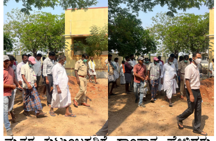
ಮೃತರ ಕುಟುಂಬಸ್ಥರಿಗೆ ಸಾಂತ್ವಾನ ಹೇಳಿದರು. ಘಟನೆಯ ಕುರಿತು ಮಾಹಿತಿ