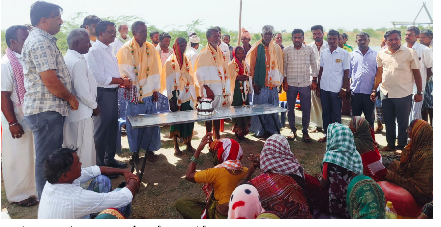
ಎಲ್ಲರೂ ಅಭಿವೃದ್ಧಿ ಗಾಗಿ ಕೈ ಜೋಡಿಸಿದರೆ, ದೇಶಕ್ಕೆ ಸ್ವಜನಾತ್ಮಕ ಕೊಡುಗೆ ನೀಡಿದಂತಾಗುತ್ತದೆ. ಒಂದು ದೇಶದ ಭವಿಷ್ಯ ಅಲ್ಲಿಯ ಕಾರ್ಮಿಕರನ್ನು ಅವಲಂಬಿಸಿರುತ್ತದೆ. ದೇಶದ ಅನೇಕ ಪ್ರತಿಭಾವಂತ ನೌಕರರು, ಕಾರ್ಮಿಕರು ಇಂದು ವಿದೇಶಗಳಲ್ಲಿ ಬದುಕು ಕಟ್ಟಿಕೊಂಡಿದ್ದಾರೆ. ಗುಳಿ ತಪ್ಪಿಸುವ ಉದ್ದೇಶದಿಂದ ಜಾರಿಗೊಳಿಸಿದ ನರೇಗಾ ಯೋಜನೆಯಿಂದಾಗಿ ಇಂದು ಅನೇಕರು ಸ್ವಂತ ಉದ್ಯೋಗಗಳಲ್ಲಿಯೇ ಬದುಕು ಕಟ್ಟಿಕೊಂಡಿದ್ದಾರೆ. ಮಕ್ಕಳಿಗೆ ಒಳ್ಳೆಯ ವಿದ್ಯಾಭ್ಯಾಸ ಒದಗಿಸಿ, ಅವರ ಭವಿಷ್ಯ ರೂಪಿಸಬೇಕು. ಬಿಸಿಲಿನ ಝಳ ಹೆಚ್ಚುತ್ತಿದ್ದು, ಆರೋಗ್ಯದ