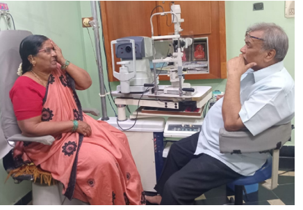
ಕಣ್ಣಿನ ಆಸ್ಪತ್ರೆಯಲ್ಲಿ ಕಾರ್ಮಿಕರಿಗೆ ಉಚಿತವಾಗಿ ಕಣ್ಣಿನ ತಪಾಸಣೆ ನಡೆಯಿತು. ಅಂಗನವಾಡಿ ಫೆಡರೇಶನ್