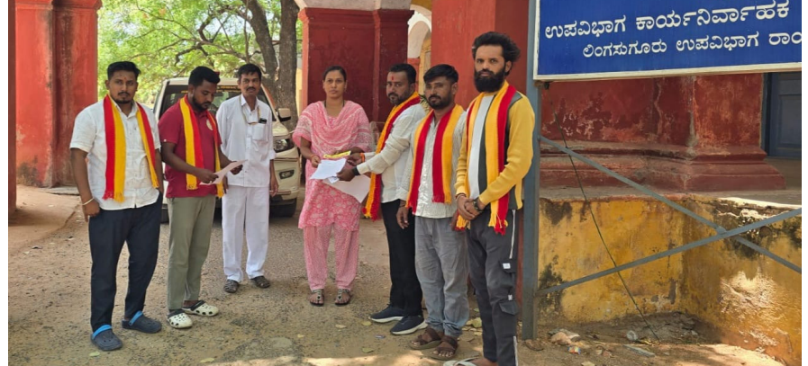
ಸಹಾಯಕ ಆಯುಕ್ತರಿಗೆ ಮನವಿಯನ್ನು ಸಲ್ಲಿಸಿ ನಂತರ ಮಾತನಾಡಿದ ಅವರು ಇಂತಹ ಅನಧಿಕೃತ ಕೋಚಿಂಗ್ ಕೇಂದ್ರಗಳು ವಿವಿಧ ರೀತಿಯಲ್ಲಿ ಕಾರ್ಯನಿರ್ವಹಿಸುತ್ತಿರುವುದು ಗುಣಮಟ್ಟದ ವಿಫಲವಾಗುತ್ತಿವೆ.