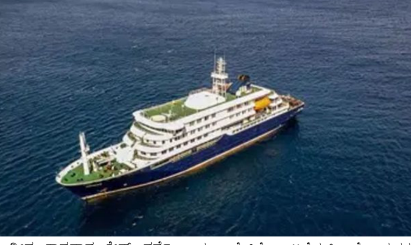
ಕರಾವಳಿಯ ದ್ವೀಪ ರಾಷ್ಟ್ರವಾದ ಕೇಪ್ ವರ್ಡೆ ಕರಾವಳಿಯಲ್ಲಿದೆ ಮತ್ತು ಸ್ಥಳೀಯ ಅಧಿಕಾರಿಗಳು ಸಹಾಯ ಮಾಡುತ್ತಿದ್ದಾರೆ ಆದರೆ ಯಾರನ್ನೂ ಇಳಿಯಲು ಅನುಮತಿಸಿಲ್ಲ ಎಂದು ಹೇಳಿದೆ. ತುರ್ತು ವೈದ್ಯಕೀಯ ಆರೈಕೆಯ ಅಗತ್ಯವಿರುವ ಹಡಗಿನಲ್ಲಿರುವ ಇಬ್ಬರು ಅಸ್ಪಷ್ಟರು ಸಿಬ್ಬಂದಿ ಸದಸ್ಯರಾಗಿದ್ದರು ಎಂದು

ನೈಜ್ಯ ದೆಸೆ ನ್ಯೂಸ್: ಕೇಪ್ ಟೌನ್: ಅಟ್ಲಾಂಟಿಕ್ ಮಹಾಸಾಗರದಲ್ಲಿ ಕ್ರೂಸ್ ಹಡಗಿನಲ್ಲಿ ಅಪರೂಪದ ಹ್ಯಾಂಟರ್‌ವೈರಸ್ ಸೋಂಕಿಗೆ ವೃದ್ಧ ದಂಪತಿಗಳು ಸೇರಿದಂತೆ ಮೂವರು ಬಲಿಯಾಗಿದ್ದಾರೆ ಮತ್ತು ಕನಿಷ್ಠ ಮೂವರು ಅಸ್ಪಷ್ಟರಾಗಿದ್ದಾರೆ ಎಂದು ವಿಶ್ವ ಆರೋಗ್ಯ ಸಂಸ್ಥೆ ಮತ್ತು ದಕ್ಷಿಣ ಆಫ್ರಿಕಾದ ಆರೋಗ್ಯ ಇಲಾಖೆ ತಿಳಿಸಿದೆ. ಅಸೋಸಿಯೇಟೆಡ್ ಪ್ರೆಸ್‌ಗೆ ನೀಡಿದ ಹೇಳಿಕೆಯಲ್ಲಿ, ತನಿಖೆ ನಡೆಯುತ್ತಿದೆ ಆದರೆ ಕನಿಷ್ಠ ಒಂದು ಹ್ಯಾಂಟರ್‌ವೈರಸ್ ಪ್ರಕರಣ ದೃಢಪಟ್ಟಿದೆ ಎಂದು ಹೇಳಿದೆ. ರೋಗಿಗಳಲ್ಲಿ ಒಬ್ಬರು ದಕ್ಷಿಣ ಆಫ್ರಿಕಾದ ಆಸ್ಪತ್ರೆಯಲ್ಲಿ ತೀವ್ರ ನಿಗಾ ಘಟಕದಲ್ಲಿದ್ದಾರೆ ಎಂದು ಆರೋಗ್ಯ ಸಂಸ್ಥೆ ತಿಳಿಸಿದೆ ಮತ್ತು ರೋಗಲಕ್ಷಣಗಳೊಂದಿಗೆ ಇನ್ನಿಬ್ಬರನ್ನು ಹಡಗಿನಿಂದ ಸ್ಥಳಾಂತರಿಸಿ ಅಧಿಕಾರಿಗಳೊಂದಿಗೆ ಕೆಲಸ ಮಾಡುತ್ತಿದೆ. ಕ್ರೂಸ್ ಅನ್ನು ನಿರ್ವಹಿಸುವ ಡಚ್ ಕಂಪನಿಯು ಹಡಗು ಈಗ ಆಫ್ರಿಕಾದ ಪಶ್ಚಿಮ