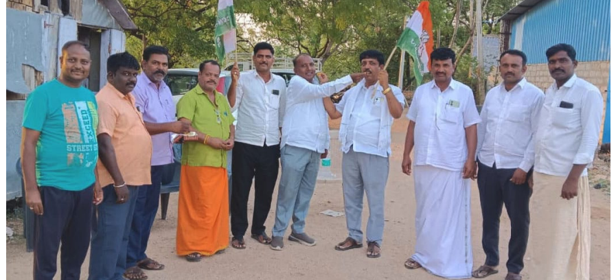
ಎರಡು ಕ್ಷೇತ್ರಗಳಲ್ಲಿ ಕಾಂಗ್ರೆಸ್ ಪಕ್ಷದ ಅಭ್ಯರ್ಥಿಗಳ ಬಲವನ್ನು ಮತ್ತೊಮ್ಮೆ ಸಾಬೀತುಪಡಿಸಿದರು. ಉಪಚುನಾವಣೆ ಫಲಿತಾಂಶ ಹಿನ್ನೆಯಲ್ಲಿ