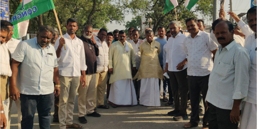
ವೃತ್ತದಲ್ಲಿ ಕಾಂಗ್ರೆಸ್ ಪಕ್ಷದ ವತಿಯಿಂದ ರಾಜ್ಯದ ಎರಡು ವಿಧಾನಸಭಾ ಕ್ಷೇತ್ರಗಳಲ್ಲಿ ನಡೆದ ಉಪ ಚುನಾವಣೆಯಲ್ಲಿ ಕಾಂಗ್ರೆಸ್ ಪಕ್ಷದ ಅಭ್ಯರ್ಥಿಗಳು