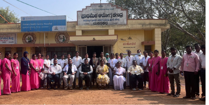
ಆರೋಗ್ಯ ಕ್ಷೇತ್ರದಲ್ಲಿ ಮಹತ್ವದ ಸಾಧನೆಯಾಗಿದೆ. ಎಲ್ಲ ವಿಭಾಗಗಳಲ್ಲಿ ಉತ್ತಮ ಕಾರ್ಯನಿರ್ವಹಣೆ ತೋರಿದ ಪರಿಣಾಮ ಉನ್ನತ ಅಂಕಗಳನ್ನು ಪಡೆದುಕೊಳ್ಳಲಾಗಿದೆ ಎಂದು ಅವರು ವಿವರಿಸಿದರು. ಮಇದನ್ನು ಮಾನದಂಡವಾಗಿ ಪರಿಗಣಿಸಿ ಜಿಲ್ಲೆಯ ಉಳಿದ ಕೇಂದ್ರಗಳನ್ನು ಈ ದಿಶೆಯಲ್ಲಿ ರೂಪಿಸಲಾಗುವುದು ಎಂದರು.

ಈ ಕುರಿತು ಮಾಹಿತಿ ನೀಡಿದ ಜಿಲ್ಲಾ ಎನ್‌ಪೋಸ್ಟೆಂಟ್ ಅಧಿಕಾರಿ ಗ್ರಾಮೀಣ ಪ್ರದೇಶಗಳಲ್ಲಿಯೂ ಉತ್ತಮ ಮತ್ತು ಮಾನದಂಡಗಳಿಗೆ ಅನುಗುಣವಾದ ಆರೋಗ್ಯ ಸೇವೆಗಳನ್ನು ಒದಗಿಸುವ ಸರ್ಕಾರದ ಉದ್ದೇಶವನ್ನು ಈ ಸಾಧನೆ ಸ್ಪಷ್ಟಪಡಿಸುತ್ತದೆ ಎಂದರು. ನಿಗದಿತ ಮಾನದಂಡಗಳನ್ನು ಕಟ್ಟುನಿಟ್ಟಾಗಿ ಅನುಸರಿಸಿ, ಅಸತ್ತೆಯ ಎಲ್ಲಾ ವಿಭಾಗಗಳಲ್ಲಿ ಗುಣಮಟ್ಟವನ್ನು ಕಾಪಾಡಿಕೊಂಡಿ ರುವುದರಿಂದಲೇ ಈ ಯಶಸ್ಸು ಸಾಧ್ಯವಾಗಿದೆ ಎಂದು ತಿಳಿಸಿದರು. ವೈದ್ಯರು, ನರ್ಸಿಂಗ್ ಸಿಬ್ಬಂದಿ ಹಾಗೂ ಇತರ ಆರೋಗ್ಯ ಸಿಬ್ಬಂದಿಯ ಪರಿಶ್ರಮ ಮತ್ತು ಸಮರ್ಪಣೆಯು ಅಡಗಿದೆ ಎಂದರು. ಸಾಧನೆ ಹೇಗೆ ಸಾಧ್ಯವಾಯಿತು. ಪ್ರತಿದಿನವೂ ರೋಗಿಗಳಿಗೆ ಗುಣಮಟ್ಟದ ಸೇವೆ ನೀಡುವ ದೃಷ್ಟಿಯಿಂದ ತಂಡವಾಗಿ ಕೆಲಸ ಮಾಡುತ್ತಿರುವ ಸಿಬ್ಬಂದಿಯ ನಿಷ್ಠೆ ಮತ್ತು ಸೇವಾಭಾವನೆ ಜೊತೆಗೆ ಸ್ಥಳೀಯ ಜನರ ಸಹಕಾರ,