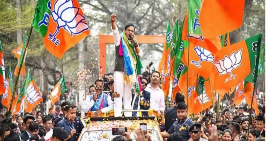
ಸದ್ಯದ ಮುನ್ನಡೆ ಪ್ರಕಾರ ಯುಡಿಎಫ್ 140 ವಿಧಾನಸಭಾ ಕ್ಷೇತ್ರಗಳ ಪೈಕಿ ಬಹುಮತಕ್ಕೆ ಅಗತ್ಯವಿರುವ 71 ಸ್ಥಾನಗಳನ್ನು ದಾಟಿ 99 ಸ್ಥಾನಗಳಲ್ಲಿ ಮುನ್ನಡೆ ಗಳಿಸಿದೆ. ಎಲ್ ಡಿಎಫ್ 39, ಬಿಜೆಪಿ-2 ಮತ್ತು ಇತರರು 12 ಕ್ಷೇತ್ರಗಳಲ್ಲಿ ಮುನ್ನಡೆ ಸಾಧಿಸಿದೆ. ಅಸ್ಸಾಂನಲ್ಲಿ ಮತ್ತೆ ಬಿಜೆಪಿ : ಕಳೆದ ಎರಡು ಅವಧಿಯಿಂದ ಅಧಿಕಾರದಲ್ಲಿರುವ ಬಿಜೆಪಿ ಅಸ್ಸಾಂನಲ್ಲಿ ಮೂರನೇ ಬಾರಿಗೆ ಅಧಿಕಾರ ಹಿಡಿಯುವತ್ತೆ ಹೆಜ್ಜೆ ಹಾಕಿದೆ, 126 ವಿಧಾನಸಭಾ ಕ್ಷೇತ್ರಗಳ ಪೈಕಿ ಬಹುಮತಕ್ಕೆ ಅಗತ್ಯವಾಗಿರುವ 64

ನವದೆಹಲಿ: ದೇಶದ ನಾಲ್ಕು ರಾಜ್ಯಗಳು ಮತ್ತು ಒಂದು ಕೇಂದ್ರಾಡಳಿತ ಪ್ರದೇಶದ ವಿಧಾನಸಭೆ ನಡೆದ ಚುನಾವಣೆಯಲ್ಲಿ ಅಸ್ಸಾಂನಲ್ಲಿ ಬಿಜೆಪಿ, ಕೇರಳದಲ್ಲಿ ಕಾಂಗ್ರೆಸ್ ನೇತೃತ್ವದ ಯುಡಿಎಫ್ ಹಾಗೂ ಪುದುಚೇರಿಯಲ್ಲಿ ಎನ್‌ಡಿಎ ಅಧಿಕಾರ ಹಿಡಿದಿದೆ. ತೀವ್ರ ಕುತೂಹಲ ಕೆರಳಿಸಿದ್ದ ನಾಲ್ಕು ರಾಜ್ಯಗಳು ಮತ್ತು ಒಂದು ಕೇಂದ್ರಾಡಳಿತ ಪ್ರದೇಶದ ವಿಧಾನಸಭೆಗೆ ನಡೆದ ಮತ ಎಣಿಕೆ ಪ್ರಗತಿಯಲ್ಲಿದ್ದು ಸ್ಪಷ್ಟ ಬಹುಮತದೊಂದಿಗೆ ಅಧಿಕಾರ ಹಿಡಿಯುವತ್ತೆ ಹೆಜ್ಜೆ ಇಟ್ಟಿದೆ. ಯುಡಿಎಫ್ ಕಮಾಲ್ : ಕೇರಳದಲ್ಲಿ ಕಳೆದ ಮೂರು ಅವಧಿಯಿಂದ ಅಧಿಕಾರದಲ್ಲಿದ್ದ ಮುಖ್ಯಮಂತ್ರಿ ಪಿಣರಾಯಿ ವಿಜಯನ್ ನೇತೃತ್ವದ ಎಡರಂಗದ ಎಲ್‌ಡಿ-ಎಫ್ ಪಕ್ಷದಿಂದ ಅಧಿಕಾರ ಕಸಿದು ಕಾಂಗ್ರೆಸ್ ನೇತೃತ್ವದ ಯುಡಿಎಫ್ ಕಮಾಲ್ ಮಾಡಿದ.