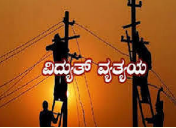
ವಿದ್ಯುತ್ ಗ್ರಾಹಕರು ಸಹಕರಿಸುವಂತೆ ಚಿಕ್ಕಾಂ ಕಾರ್ಯ ಮತ್ತು ಪಾಲನೆ ಗ್ರಾಮೀಣ ಉಪ ವಿಭಾಗದ ಸಹಾಯಕ ಕಾರ್ಯನಿರ್ವಾಹಕ ಅಭಿಯಂತರರು ಪ್ರಕಟಣೆಯಲ್ಲಿ ತಿಳಿಸಿದ್ದಾರೆ.

ರಾಯಚೂರು: ಚಿಕ್ಕಾಂ ಕಾರ್ಯ ಮತ್ತು ಪಾಲನೆ ಗ್ರಾಮೀಣ ಉಪ ವಿಭಾಗದ ವ್ಯಾಪ್ತಿಗೆ ಬರುವ 33/11 ಕೆವಿ ಕಲ್ಪಲಾ ವಿದ್ಯುತ್ ಉಪ ಕೇಂದ್ರದಲ್ಲಿ ತುರ್ತು ನಿರ್ವಹಣಾ ಕಾರ್ಯ ಹಮ್ಮಿಕೊಂಡಿರುವ ಪ್ರಯುಕ್ತ ಮೇ.13ರ ಬೆಳಿಗ್ಗೆ 8ರಿಂದ ಸಂಜೆ 5 ಗಂಟೆವರೆಗೆ ಕಲ್ಪಲಾ ವ್ಯಾಪ್ತಿಯಲ್ಲಿ ವಿದ್ಯುತ್ ಪೂರೈಕೆಯಲ್ಲಿ ವ್ಯತ್ಯಯವಾಗಲಿದ್ದು,