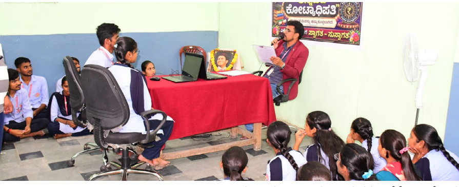
ಶಕ್ತಿ ವೃದ್ಧಿ ಹಾಗೂ ಮನರಂಜನೆಗೆ ಉತ್ತೇಜನ ನೀಡುವ ಉದ್ದೇಶದಿಂದ ನಗರದ ಎಂ.ಎಸ್. ದೇಸಾಯಿ ಪದವಿ ಮಹಾವಿದ್ಯಾಲಯದಲ್ಲಿ "ಕನ್ನಡ ಕೋಟ್ಯಾಧಿಪತಿ" ವಿಶೇಷ ಕಾರ್ಯಕ್ರಮವನ್ನು ಆಯೋಜಿಸಲಾಯಿತು.