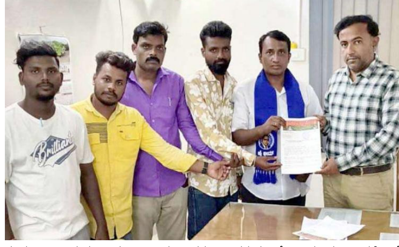
ಪವಿತ್ರವಾಗಿ ಇಡುವ ಬದಲು, ಸಾರ್ವಜನಿಕರು ಬಳಸುವ ಟೀಬಲ್‌ನ ಕಬರ್ಡ್‌ನಲ್ಲಿ ಬೇಕಾಬಿಟ್ಟೆ