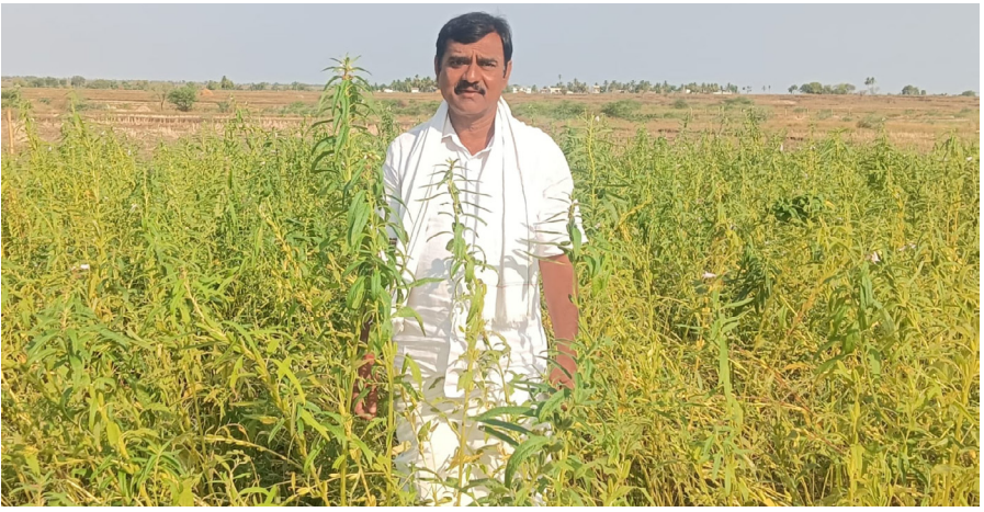
ಕೋಟೆ ವಿದ್ಯೆಗಳಲ್ಲಿ ಮೇಟೆ ವಿದ್ಯೆಯೇ ಮೇಲು' ಎಂಬ ಸರ್ವಜ್ಞರ ಮಾತಿನಂತೆ, ಎಲ್ಲಾ ವಿದ್ಯೆಗಿಂತಲೂ