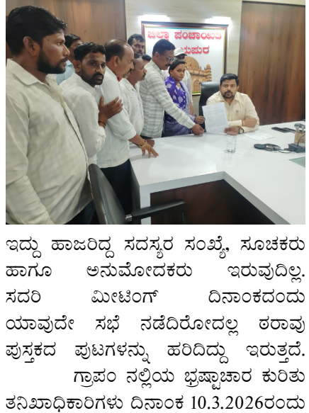
ಇದ್ದು ಹಾಜರಿದ್ದ ಸದಸ್ಯರ ಸಂಖ್ಯೆ ಸೂಚಕರು ಹಾಗೂ ಅನುಮೋದಕರು ಇರುವುದಿಲ್ಲ. ಸದರಿ ಮೀಟಿಂಗ್ ದಿನಾಂಕದಂದು ಯಾವುದೇ ಸಭೆ ನಡೆದಿರೋದಲ್ಲ ಠರಾವು ಪುಸ್ತಕದ ಪುಟಗಳನ್ನು ಹರಿದಿದ್ದು ಇರುತ್ತದೆ. ಗ್ರಾಪಂ ನಲ್ಲಿಯ ಭ್ರಷ್ಟಾಚಾರ ಕುರಿತು ತನಿಖಾಧಿಕಾರಿಗಳು ದಿನಾಂಕ 10.3.2026ರಂದು