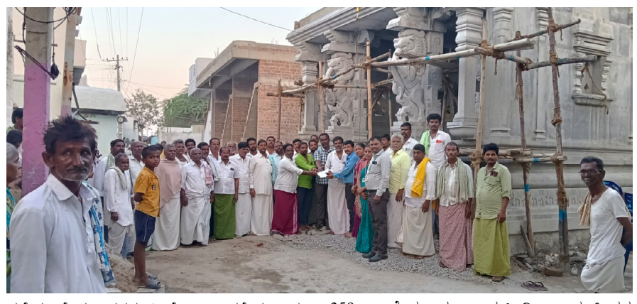
ಹಳೆಯ ದೇವಸ್ಥಾನಗಳ ಜೀರ್ಣೋದ್ಧಾರಕ್ಕೆ ಸಹಾಯ ಹಸ್ತ ಚಾಚಿತ್ತು, ರಾಜ್ಯಾದ್ಯಂತ ಸಾವಿರಾರು ದೇವಸ್ಥಾನಗಳು, ಮಸೀದಿಗಳು, ಚರ್ಚ್‌ಗಳ ಜೀರ್ಣೋದ್ಧಾರ ಮಾಡಲಾಗಿದೆ ಎಂದು ತಿಳಿಸಿದರು. ಇದಲ್ಲದೆ ಸಿರುಗುಪ್ಪ ತಾಲೂಕಿನಲ್ಲಿ 359 ದೇವಸ್ಥಾನ, ಮಸೀದಿ, ಚರ್ಚ್‌ಗಳ ಶ್ರದ್ಧಾಕೇಂದ್ರ ಸ್ವಚ್ಛತಾ ಕಾರ್ಯಕ್ರಮ ಮಾಡುವುದರ ಜೊತೆಗೆ ದೇವಸ್ಥಾನಗಳಲ್ಲಿ ಕಸ ವಿಲೇವಾರಿಗೆ ಪರಿಶರಗಳನ್ನು ವಿತರಿಸಲಾಗಿದೆ ಇದರಿಂದ ಎಲ್ಲಾ ಧಾರ್ಮಿಕ ಶ್ರದ್ಧಾ ಕೇಂದ್ರಗಳು ಸ್ವಚ್ಛತೆಯಿಂದ