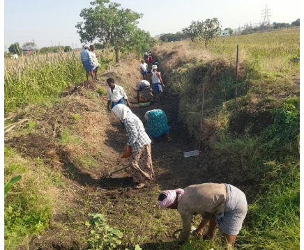
ಸಾಲಿನಿಂದ ಜಿಲ್ಲೆಯಲ್ಲಿ ಬದಲಾದ ಹೊಸ ರೂಪದೊಂದಿಗೆ ಚಾಲನೆ ನೀಡಲಾಗಿದೆ. ಜಿಲ್ಲೆಯ ಬಳ್ಳಾರಿ ಸಂಡೂರು ಕಂಪ್ಲಿ ಕುರುಗೋಡು ಸಿರುಗುಪ್ಪ ಒಟ್ಟು ಐದು ತಾಲೂಕುಗಳಲ್ಲಿ 100 ಗ್ರಾಮ ಪಂಚಾಯತಿಗಳಿದ್ದು ಪ್ರಸಕ್ತ 2026-27 ನೇ ಸಾಲಿನಲ್ಲಿ ವಿಬಿ- ಜಿ ರಾಮ್ ಜಿ ಅಡಿ ಮೇ ಅಂತ್ಯದವರೆಗೆ 18.45 ಲಕ್ಷ ಮಾನವ ದಿನಗಳ ಸೃಜನೆಯ ಗುರಿ ಹೊಂದಿದ್ದು ಸಾಧನೆಗಾಗಿ ಜಿಲ್ಲೆಯಲ್ಲಿ ವಿಪ್ರೀತ್ ನಿಂದ ಕಾಮಗಾರಿ ಭರದಿಂದ ಪ್ರಾರಂಭಗೊಳಿಸಲಾಗಿದೆ ಬಳ್ಳಾರಿ ಜಿಲ್ಲೆಯಲ್ಲಿ ಒಟ್ಟು 1,85,797 ಉದ್ಯೋಗ ಚಟೀಗಳು ನೋಂದಾಯಿಸಲಾಗಿವೆ ಅದರಲ್ಲಿ 22,387 ಕುಟುಂಬಗಳ ಕಾರ್ಮಿಕರು ಸಕ್ರಿಯವಾಗಿ ಉದ್ಯೋಗದಲ್ಲಿ ತೊಡಗಿಸಿಕೊಂಡಿದ್ದಾರೆ ಪ್ರಸಕ್ತ ಸಾಲಿನಲ್ಲಿ ಮಾನವ ದಿನಗಳ ಗುರಿ ತಲುಪಲು ತಾಲೂಕುವಾರು ನಿಗದಿಪಡಿಸಿದ ಗುರಿಯನ್ನು ಬೆನ್ನತ್ತುವ ಮೂಲಕ ಮಾನವ ದಿನಗಳ ಸೃಜನೆಯಲ್ಲಿ ರಾಜ್ಯದಲ್ಲಿಯೇ ಗಮನ

ನೈಜ್ಯ ದೆಸೆ ನ್ಯೂಸ್ ಸಿರುಗುಪ್ಪ: ಮಾನವ ದಿನಗಳ ಸೃಜನೆಯಲ್ಲಿ ಬಳ್ಳಾರಿ ಜಿಲ್ಲೆಗೆ ಮೇ ಅಂತ್ಯದವರೆಗೆ ನಿಗದಿಯಾಗಿದ್ದ 18.45 ಲಕ್ಷ ಸೃಜನೆ ಗುರಿಯಲ್ಲಿ ಈವರೆಗೆ 2,52,011 ಸೃಜಿಸುವ ಮೂಲಕ ರಾಜ್ಯಕ್ಕೆ ಎರಡನೇ ಸ್ಥಾನದಲ್ಲಿ ಗುರುತಿಸಿಕೊಂಡಿದೆ ರಾಯಚೂರು ಜಿಲ್ಲೆ ಮೊದಲನೇ ಸ್ಥಾನದಲ್ಲಿ ರಾಯಚೂರು ಜಿಲ್ಲೆ 3ನೇ ಸ್ಥಾನದಲ್ಲಿ ಉದ್ಯೋಗದಲ್ಲಿ ಪಾಲ್ಗೊಳ್ಳುವ ಕಾರ್ಮಿಕರ ಪೈಕಿ ಜಿಲ್ಲೆಯಲ್ಲಿ ಶೇ. 59.29 ರಷ್ಟು ಮಹಿಳಾ ಕಾರ್ಮಿಕರೇ ಹೆಚ್ಚಿನ ಸಂಖ್ಯೆಯಲ್ಲಿರುವುದು ಗಮನಾರ್ಹವಾಗಿದೆ. ಎಂದು ಲೋಕ ಶಿಕ್ಷಣ ಸಾಕ್ಷರತಾ ಸದಸ್ಯರು ಸಾಮಾಜಿಕ ಕಾರ್ಯಕರ್ತ ಅಬ್ದುಲ್ ನಬಿಯವರು ತಿಳಿಸಿದರು ಬಳ್ಳಾರಿ ಜಿಲ್ಲೆಯ 100 ಗ್ರಾಮ ಪಂಚಾಯತಿಗಳಲ್ಲಿ 2.50 ಲಕ್ಷ ಮಾನವ ದಿನ ಸೃಜನೇ ಮನರೇಗಾ ಕೆಲಸದಲ್ಲಿ 25,169 ಕುಟುಂಬಗಳು ಸಕ್ರಿಯ ಬಳ್ಳಾರಿ ಜಿಲ್ಲೆಯಲ್ಲಿ ಒಟ್ಟು 1.85 ಲಕ್ಷ ಉದ್ಯೋಗ ಚಟೀಗಳು ವಿಕಸಿತ ಭಾರತ ರೋಜ್ ಗಾರ್ ಮತ್ತು ಆಜೀವಿಕಾ ಮಿಷನ್ (ವಿಬಿ- ಜಿ ರಾಮ್ ಜಿ ) ಯೋಜನೆ ಅಡಿ ಪ್ರಸಕ್ತ ಸಾಲಿನಲ್ಲಿ ಆರಂಭಗೊಂಡಿರುವ ಕಾಮಗಾರಿಗಳಲ್ಲಿ ಮಾನವ ದಿನಗಳ ಸೃಜನೆಯಲ್ಲಿ ಗಣಿ ಜಿಲ್ಲೆ ರಾಜ್ಯಕ್ಕೆ ಎರಡನೇ ಸ್ಥಾನದಲ್ಲಿ ಗುರುತಿಸಿಕೊಂಡಿದೆ ಮಹಾತ್ಮ ಗಾಂಧಿ ರಾಷ್ಟ್ರೀಯ ಗ್ರಾಮೀಣ ಉದ್ಯೋಗ ಖಾತರಿ ಕಾಯಿದೆಯನ್ನು ಮರುರೂಪಿಸಿ ಜಾರಿಗೆ ತರಲಾದ ವಿ ಬಿ ಐ ರಾಮ್ ಜಿ ಹೊಸ ಕಾಯಿದೆಯಡಿ ಪ್ರಸಕ್ತ