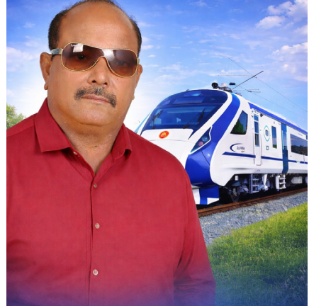
ಕಲಬುರಗಿ ಮೂಲಕ ಬೀದರ್ಗೆ ಸಂಚರಿಸುವ ವಿಶೇಷ ರೈಲು ಕಾಯಂಗೊಳಿಸಲಾಗಿದೆ. ಈ ಬದಲಾವಣೆ ಮೇ 15ರಿಂದ ಜಾರಿಗೆ ಬರಲಿವೆ. ಪ್ರತಿ ಶುಕ್ರವಾರ ಮತ್ತು ಭಾನುವಾರ