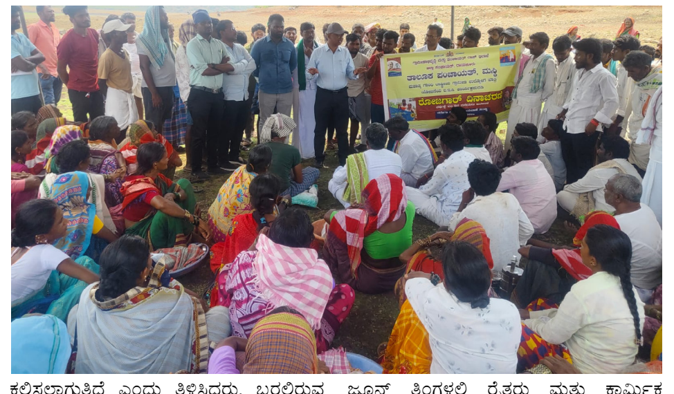
ಕಲ್ಪಿಸಲಾಗುತ್ತಿದೆ ಎಂದು ತಿಳಿಸಿದರು. ಬರಲಿರುವ ಜೂನ್ ತಿಂಗಳಲ್ಲಿ ರೈತರು ಮತ್ತು ಕಾರ್ಮಿಕ