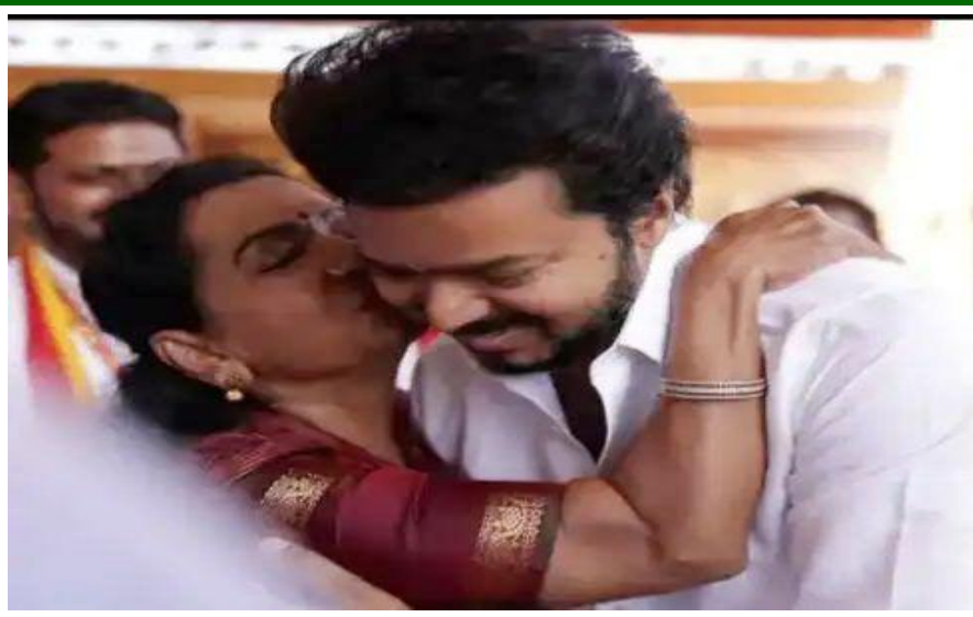
ಅಭಿಮಾನಿಗಳು ಇದನ್ನು ಅವರ ಪದಗ್ರಹಣ ಸಮಾರಂಭಕ್ಕೆ ಸಂಬಂಧಿಸಿದ ಅತ್ಯಂತ "ಸಾರ್ಥಕ ಕ್ಷಣ" ಎಂದು ಬಣ್ಣಿಸುತ್ತಿದ್ದಾರೆ. ಪ್ರಮಾಣ ವಚನ ಸ್ವೀಕಾರ ಸಮಾರಂಭವು ತಾಯಂದಿರ ದಿನದಂದೇ ನಡೆದಿದ್ದರಿಂದ, ನೆಟ್ಟಿಗರು ಸಾಮಾಜಿಕ ಜಾಲತಾಣಗಳಲ್ಲಿ ಭಾವುಕ ಪ್ರತಿಕ್ರಿಯೆಗಳನ್ನು ಹರಿಸುತ್ತಿದ್ದಾರೆ. ವಿಜಯ್ ತಮಿಳುನಾಡಿನ

ಚೆನ್ನೈ:ಭಾನುವಾರ ಸಿ. ಜೋಸೆಫ್ ವಿಜಯ್ ಅವರು ತಮಿಳುನಾಡಿನ ಮುಖ್ಯಮಂತ್ರಿಯಾಗಿ ಪ್ರಮಾಣ ವಚನ ಸ್ವೀಕರಿಸುವ ಮೂಲಕ ಇತಿಹಾಸ ನಿರ್ಮಿಸಿದ ಬೆನ್ನಲ್ಲೇ, ಅವರ ತಾಯಿಯೊಂದಿಗಿನ ಭಾವುಕ ಕ್ಷಣವೊಂದು ಸಾಮಾಜಿಕ ಜಾಲತಾಣಗಳಲ್ಲಿ ವೈರಲ್ ಆಗಿದ್ದು, ತಾಯಂದಿರ ದಿನದಂದು ಅಭಿಮಾನಿಗಳನ್ನು ಭಾವುಕರನ್ನಾಗಿಸಿದೆ. ಈಗ ವೈರಲ್ ಆಗಿರುವ ಆ ಫೋಟೋ (ಹಳೆಯದೊಂದು ಫೋಟೋ ಈಗ ಮರುಕಳಿಸಿದೆ ಎಂದು ನಂಬಲಾಗಿದೆ), ವಿಜಯ್ ಅವರ ತಾಯಿ ಅವರನ್ನು ಪ್ರೀತಿಯಿಂದ ಅಪ್ಪಿಕೊಂಡು, ಅವರ ಕೆನ್ನೆಗೆ ಹೆಮ್ಮೆಯ ಮತ್ತು ನೀಡುತ್ತಿರುವುದನ್ನು ತೋರಿಸುತ್ತದೆ. ಈ ವೇಳೆ ನಟ-ರಾಜಕಾರಣಿ ವಿಜಯ್ ಅವರು ಮುಗುಳ್ಳುಗುತ್ತಿರುವುದನ್ನು ಕಾಣಬಹುದು. ಈ ಮನಮುಟ್ಟುವ ಚಿತ್ರವು ನೆಟ್ಟಿಗರ ಗಮನ ಸೆಳೆದಿದ್ದು,