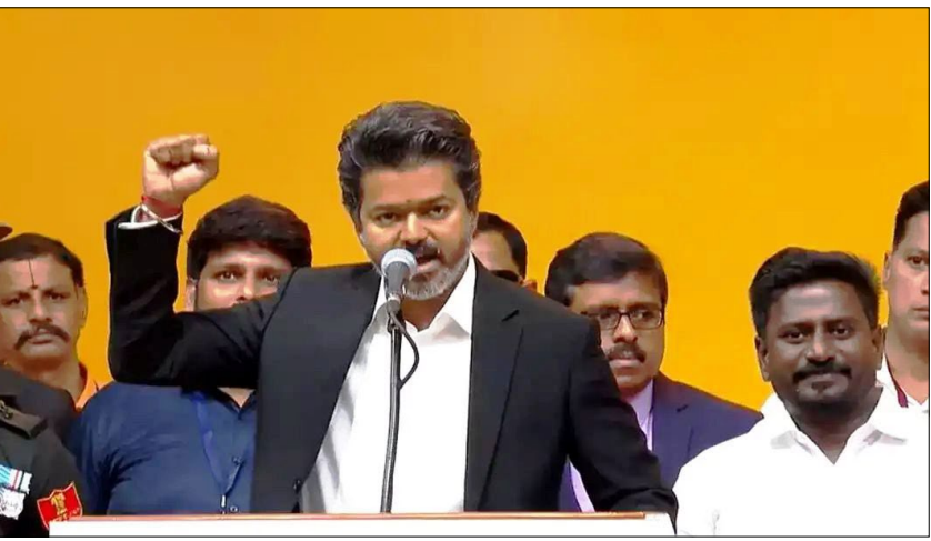
ಕ್ರೀಡಾಂಗಣದಲ್ಲಿ ಘೋಷಣೆಗಳು ಮೊಳಗಿದವು. ವಿಜಯ್ ಪ್ರಮಾಣ ವಚನ ಸ್ವೀಕರಿಸಲು

ಎದ್ದಾಗ ಅಭಿಮಾನಿಗಳ ಸಂಭ್ರಮ ತಾರಕಕ್ಕೇರಿತ್ತು.ರಾಜ್ಯಪಾಲರು ಪ್ರಮಾಣ ವಚನ ಬೋಧನೆ ಆರಂಭಿಸಿದ ಬಳಿಕ ವಿಜಯ್ ಅವರು ಯಾವುದೇ ಪ್ರತಿಯನ್ನು ನೋಡದೆ ತಮಿಳಿನಲ್ಲಿ ಆತ್ಮವಿಶ್ವಾಸದಿಂದ ಗಟ್ಟಿ ದನಿಯಲ್ಲಿ ಪ್ರಮಾಣ ವಚನ ಸ್ವೀಕರಿಸಿದರು. "ಭಾರತ ಸಂವಿಧಾನಕ್ಕೆ ನಿಷ್ಠೆ ಮತ್ತು ಅಚಲ ವಿಶ್ವಾಸ ಹೊಂದಿರುತ್ತೇನೆ. ಭಾರತದ ಸಾರ್ವಭೌಮತ್ವ ಮತ್ತು ಏಕತೆಯನ್ನು ಕಾಪಾಡುತ್ತೇನೆ. ತಮಿಳುನಾಡಿನ ಮುಖ್ಯಮಂತ್ರಿಯಾಗಿ ನನ್ನ ಕರ್ತವ್ಯಗಳನ್ನು ಪ್ರಾಮಾಣಿಕವಾಗಿ ನಿರ್ವಹಿಸುತ್ತೇನೆ. ಭಯ, ಪಕ್ಷಪಾತ ಅಥವಾ ವೈಯಕ್ತಿಕ ಇಷ್ಟ-ಅನಿಷ್ಟಗಳಿಗೆ ಒಳಗಾಗದೆ ಎಲ್ಲ ವರ್ಗದ ಜನರಿಗೆ ನ್ಯಾಯ ಒದಗಿಸುತ್ತೇನೆ" ಎಂದು ಅವರು ಪ್ರಮಾಣ ಮಾಡಿದರು.ಆ ವೇಳೆ ಮಧ್ಯಪ್ರವೇಶಿಸಿದ ರಾಜ್ಯಪಾಲರು ವಿಜಯ್