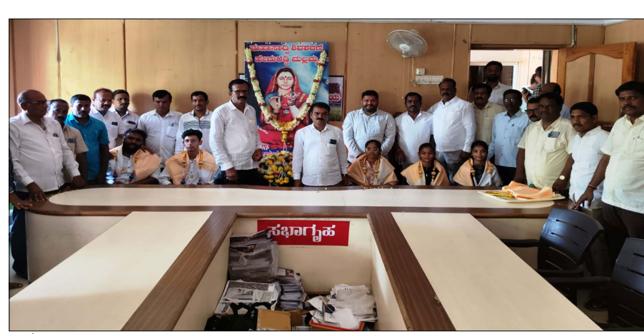
ಮಾನ್ಯ : ಮಹಾಸದ್ಧಿ ಶಿವಶರಣೆ ಹೇಮರೆಡ್ಡಿ ಮಲ್ಲಮ್ಮನವರ 604ನೇ ಜಯಂತಿಯನ್ನು ಪಟ್ಟಣದ